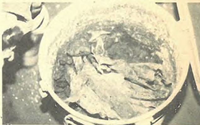
0,25% jodid thalnatý v prosté popelnici v bunkru ve Zlaté Olešnici

Věřím, že bude-li nutné k pomoci vyzvat širokou trutnovskou veřejnost, že se k nám přidá tak, jak tomu je v případě obyvatel ve Zlaté Olešnici.