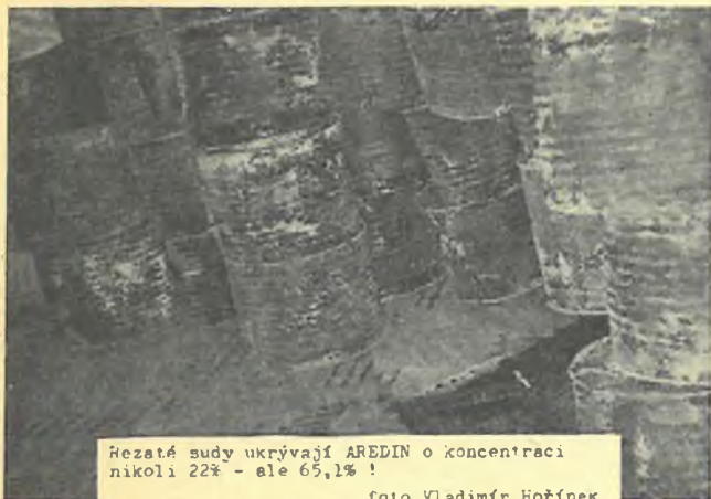
Hezkaté sudy ukryvají AREDIN o koncentraci nikoli 22% - ale 65,1% !

Dále chceme podotknout, že ze strany OHS i pracovníků ZZN došlo k mystifikaci všech pracovníků. Mělo se jednat o Aredin 16-22 %. Na základě toxikologického rozboru jde o Aredin 65,1 % ".