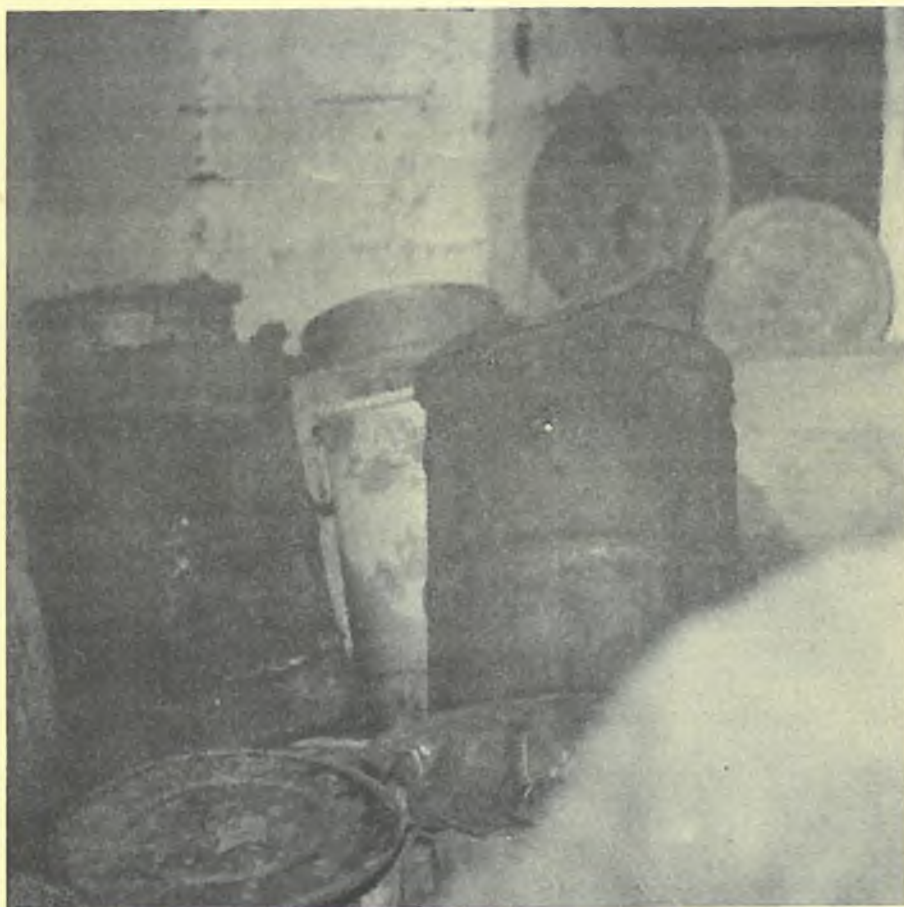
"Pečlivě" uskladněné chemikálie - Zlatá Olešnice