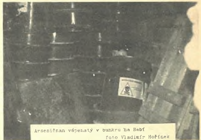
Arzeničnan vápenatý v bunkru na Babí

nosti stavby, kde určil Monokrystalům Turnov přesné podmínky, za jakých je možno uskladnění provést. Tímto uvedeným rozhodnutím bylo povoleno skladovat v bunkru T-64 jodid sodný s určitým váhovým množstvím (jedná se o setiny) jodidu thalného. Jiný jed nebyl povolen. Na základě dalšího jednání potom provedl ředitel podniku kolaudační řízení v roce 1968 a toto rozhodnutí již na OHS doručeno nebylo. Jasně to vyplývá z rozdělovníku. Ani v následujících letech nebyla v žádném případě informována OHS o jakékoliv manipulaci čili navázení jakékoliv látky do uvedeného bunkru a nebyly zjištěny žádné stopy po jakékoliv využívání. Vzhledem k tomu, že ani v dalších letech jsme nebyli informováni o skladování látek, nebyl tento bunkr evidován. Prakticky o manipulaci s jedovatými látkami v uvedeném bunkru T-64 jsme se oficiálně dozvěděli v lednu 1990. Je povinností uživatele, aby hlásil ve smyslu příslušného vládního nařízení č. 192/88 Sb. manipulaci s jedovatými látkami na OHS a podle příslušného nařízení pracovníci OHS sledují pouze zabezpečení dělníků po stránce zdravotní, kteří manipulují s jedovatými látkami, aby nedošlo k poškození. Není však v žádném případě pravdou, že by pracovníci OHS byli povinni kontrolovat objekty jako takové."