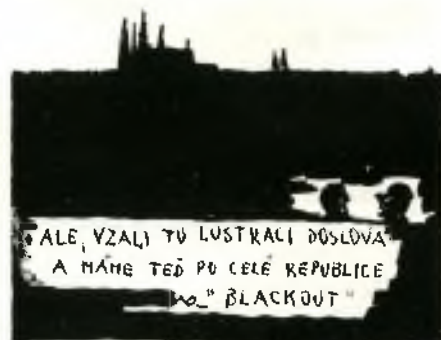
... ALE, VZALI TU LUSTRACI DŮSLOVA A NÁHE TEĎ PO CELE REPUBLICE ... "BLACKOUT"

Éh, čert vás vem, elektrony - prskejte si závistí ! Na doskoky já byl vždycky kanón.