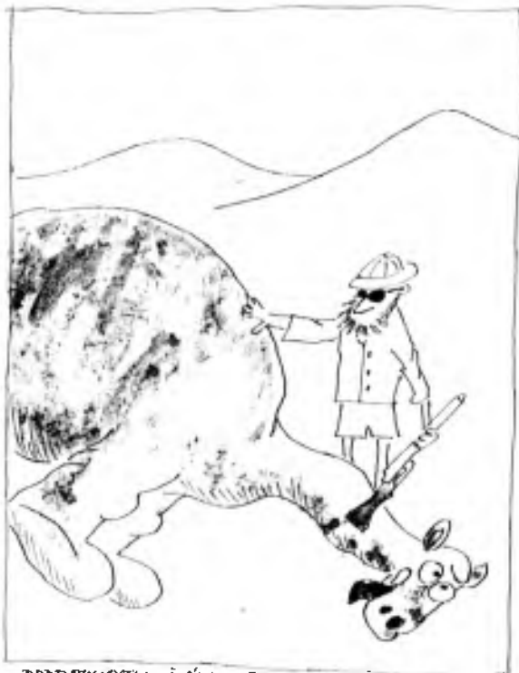
PODROBNOSTI V ČLÁNKU „PRAVDA O BRNOSAURŮM“