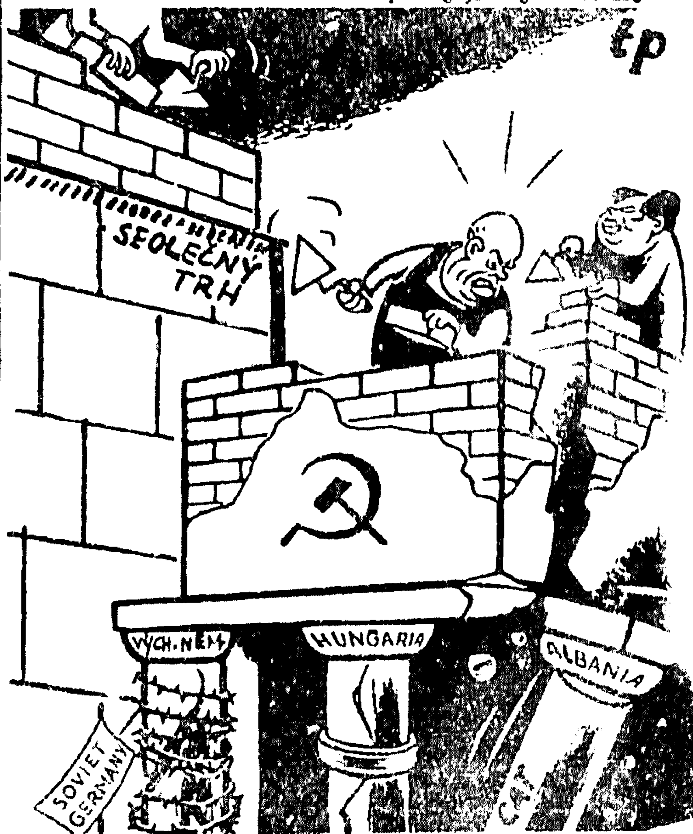
JAK SE STAVÍ U NICH A U NÁS. (Společ. trh)

O ČEM PÍŠE FCI : Úvodník se zabýval nebezpečím, že po rozkolu s Moskvou, Západ otevře dveře albánským diplomatickým misím, které nebudou nic jiného než semeništěm rušské čínské špiónáže. *Zprávy: Vytvoření čs. komise na rozbíjení Stalinova poražení v Praze. * O světovém úspěchu "S5" s podtitulem "zem na Figaro (připojena reprodukce) *Reportáž o poměrech v trestnici Leopoldov. *Další zpr. ... Německo - Turcko, Litvy, Kubu a Rum.