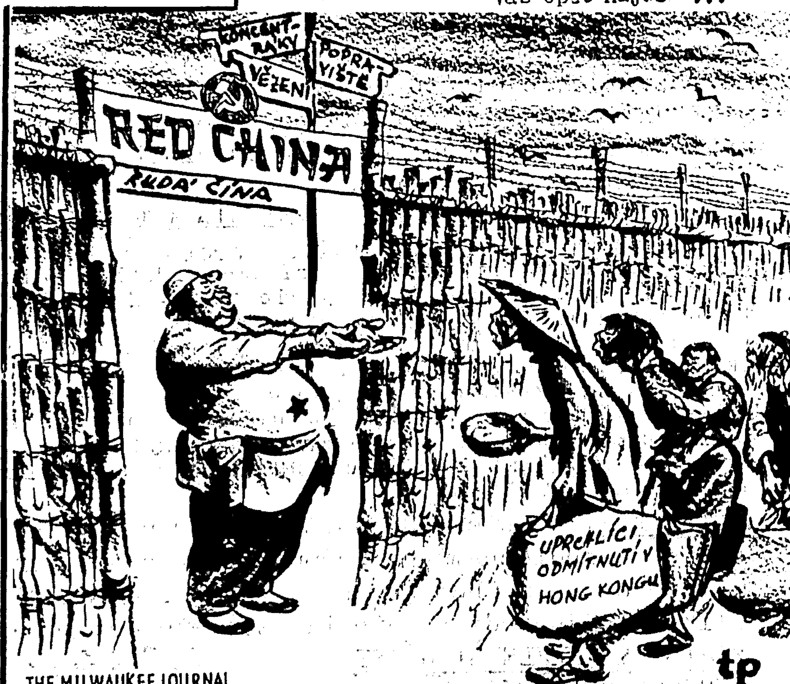
THE MILWAUKEE JOURNAL