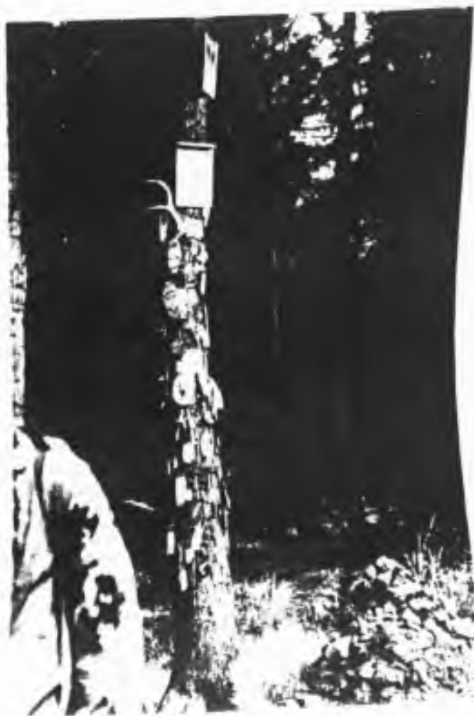
"gret' ito" - Brdy