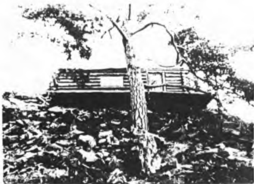
bývalé sruby na „Hle ivci“ - Brdy