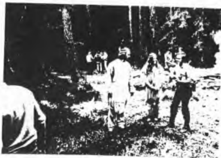
Fotlach na Brdech