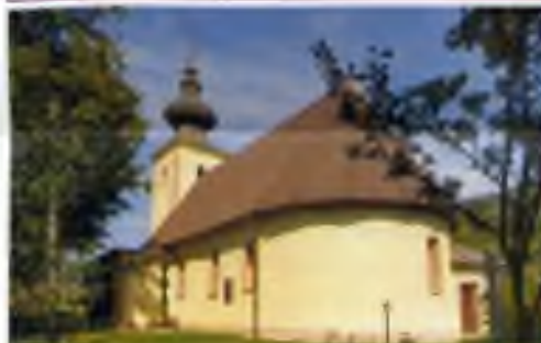
farní kostel v obci Tichý Potok

* 4. srpna 1936 Tichý Potok na východním Slovensku (okr. Sabinov) ✠ 16. května 2024 Zwiesel ve věku 87 let