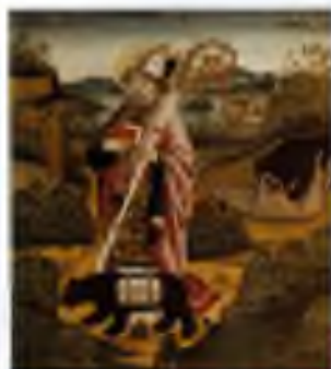
svatý Korbinián, patron mnichovské arcidiecéze