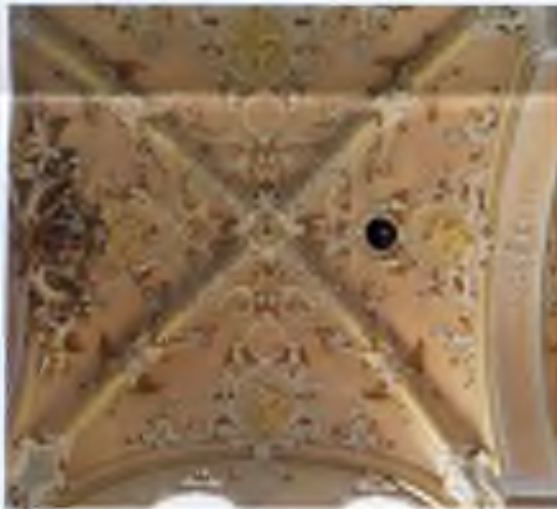
Rokokový strop baziliky sv. Víta v Ellwangen