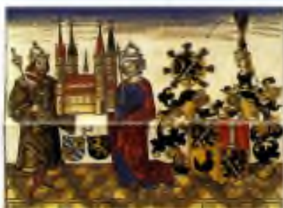
svatý Jindřich a sv. Kunigunde, patroni arcidiecéze Bamberg