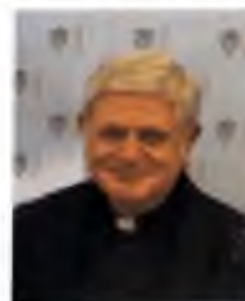
Mons. Dušan Hladík