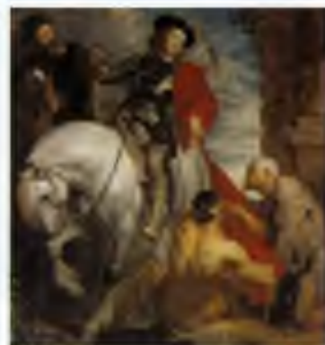
svatý Martin, patron diecéze Rottenburg - Stuttgart

Slovenské bohoslužby: Stuttgart - Böblingen - Mannheim - Kaiserslauten www.nemecko-misie.com