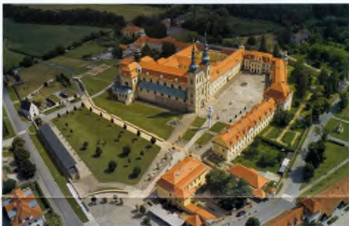
Bazilika Nanebevzetí Panny Marie a svatého Cyrila a Metoděje na Velehradě

"Dobrý Bože, daroval jsi nám čas prázdnin a dovolených. Ať si v létě odpočineme a nabere novou sílu k životu s Bohem, s bližními i sami se sebou."