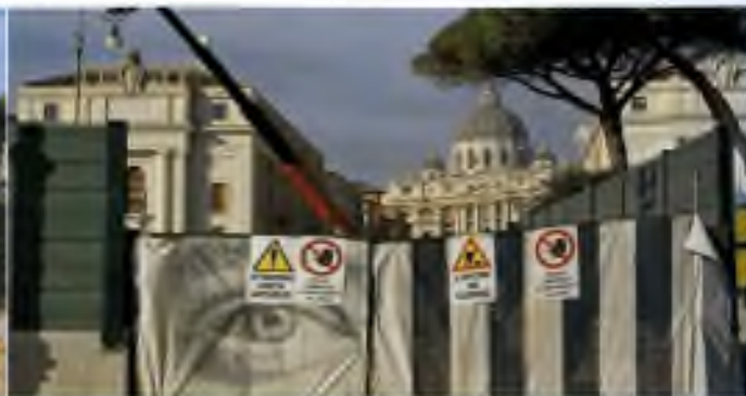
Dvě staveniště v blízkosti Vatikánu, které mají zlepšit dopravní strukturu Říma.