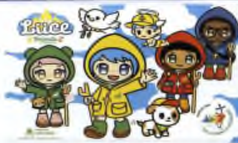
Infopoint Svatého roku - Chrám sv. Petra: Svatá brána vykoupení - oficiální maskot Svatého roku: "Luce"