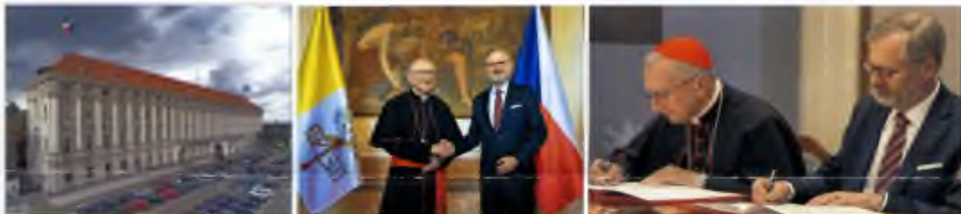
budova vlády České republiky v Praze - kardinál Pietro Parolin a předseda vlády Petr Fiala - podpis smlouvy

Hlavním obsahem smlouvy je potvrzení vzájemných vztahů a posílení ochrany svobody vyznání občanů. Smlouva rovněž zajišťuje právní ochranu duchovní služby v různých institucích, jako jsou nemocnice, věznice nebo armáda. Chrání nejen zájmy katolické církve, ale všech církví a náboženství praktikovaných na našem území. Ve smlouvě je výslovně napsáno, že "zpovědní tajemství se uznává za podmínek daných právním řádem České republiky."