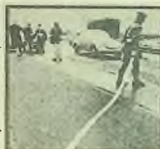
V BOJI PROTI vzrůstající vně i vnitřní pozitivní italské policii při uzavření zvláštního pásu s smělou hmotou, opatřenou ostrými hroty. Tyto hroty propichnou jakoukoliv pneumatiku, a tím se prakticky stává vůz snadno dostižitelným. (dv)

Jako politický vězeň v nacistickém koncentračním táboře v Dachau povzbuzoval, krmil umírající spoluvězně. Českoslovenští uvěznění kněží v něm viděli svého misionáře. Smysl pro misionářství přenesl i do čsl. exilu. Na všech svých životních zastávkách v cizině šířil víru v Boha. Burcoval čsl. exulanty k naději, že svoboda bude opět Československu navrácena, když čsl. exulanti a trpící lid v rodné vlasti zesílí svou víru v Boha.