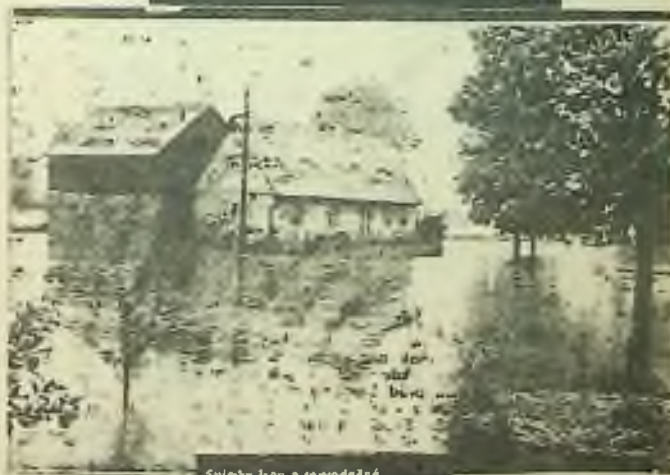
Snímek jsou z rovněžnánské lázně Smědské na Frýdantsku, která svým krásným pohledem a velkým spádem patří mezi lázně s nejkrásnějšími předpovědi.

Od 31. července do 3. srpna 1977 v ČSR téměř nepřetržitě přišlo