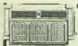
MACH furniture 3720 W. 26th St.

Dobrý obchodní výkon je provádět bankovníctví tam, kde obdržíte ÚPLNOU BANKOVNÍ SLUŽBU