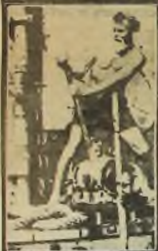
Stařec při práci na varu

Těba dodat, že ještě před australskými břehy se setkal s anglickou nákladní lodí. Kapitán nabízel osamělému mořeplavci, že ho vezme na palubu dále do Sydney. Zesláblý poutník hrdě odmítl. Výpravu ukončil bez kapky pitné vody v ústí řeky Tully poblíž Townsville. Trasu od peruánského k australskému pobřeží v délce téměř 20 000 kilometrů urazil celkem za 204 dní, což se do té doby nikomu nepodařilo.