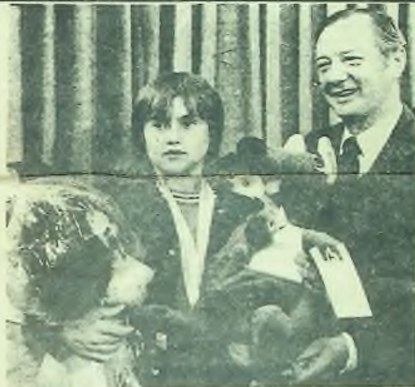
Starosta města Chicaga Bilandic předává dary nejlepší světové gymnastce Nadi Comaneci

Soud se čtyřmi československými zastánci lidských práv vzbudil vlnu protestů v zahraničí a zejména mezi delegáty západních zemí na Bělehradské konferenci. Delegát USA Arthur Goldberg odsoudil tento provokační proces.