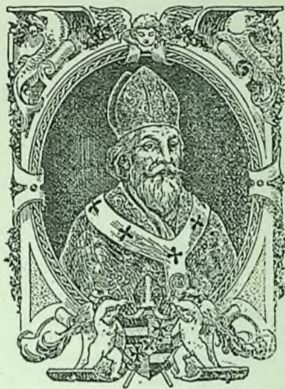
Antonín Brus z Mohelnice, arcibiskup pražský.

ve čtvrtek ochtáb Nanebevzetí Panny Marie, před sv. Bartholomějem, Vladislav , prvorozený syn krále Kazimíra III. Polského, mládenec stáří let 16, korunován v kostele sv. Víta na hradě pražském od biskupův polských, kteříž s ním přijeli a kteréž potom za tou příčinou papež Sixtus IV. chtěje míti Matyáše krále uherského, do klatby dal. Po vykonání