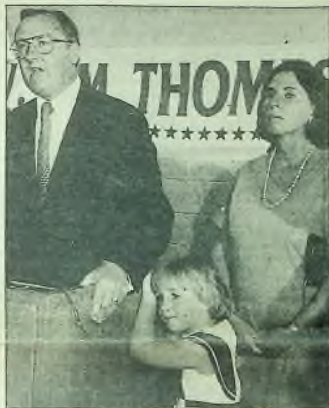
Veřejné vystoupení v Chicagu spojené s tiskovou konferencí.