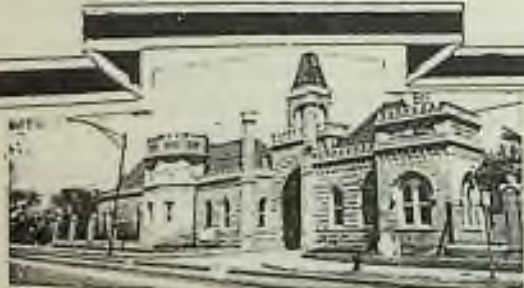
Ceský národní hřbitov v Chicagu

Již přes 100 let dobře slouží potřebám československé krajské veřejnosti v Chicagu a okolí.