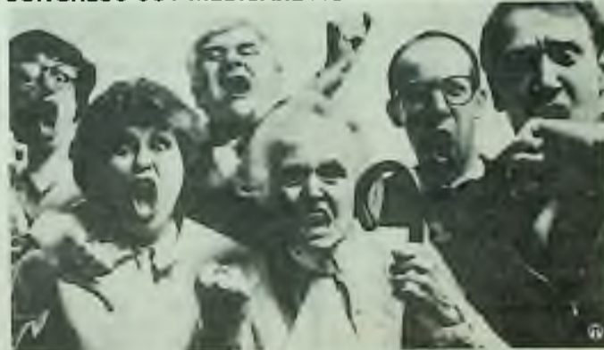
You: Up in arms over proposals to cut Medicare benefits?

• Over the past four years, the nation's hospitals have absorbed