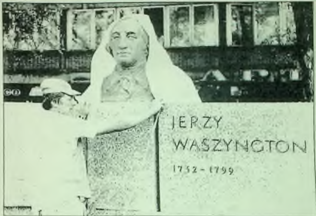
Při přípravách na návštěvu Varšavy prezidenta Bushe minulý víkend upravuje polský dělník bustu prvního amerického prezidenta. Jeho jméno je ovšem vyryto tak, jak se píše v polštině.

Popsal prezidentovu Pokračování na str. 8