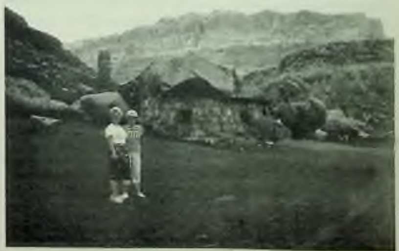
Opouštěné indiánské chaloupky