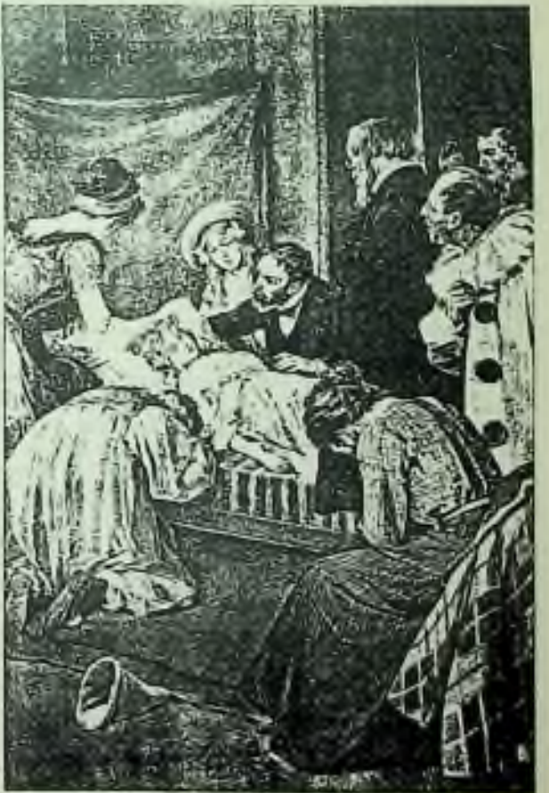
Sklonil se nad omdlelou dívkou, chtěje poznati, dýchá-li ještě. (Str. 198.)