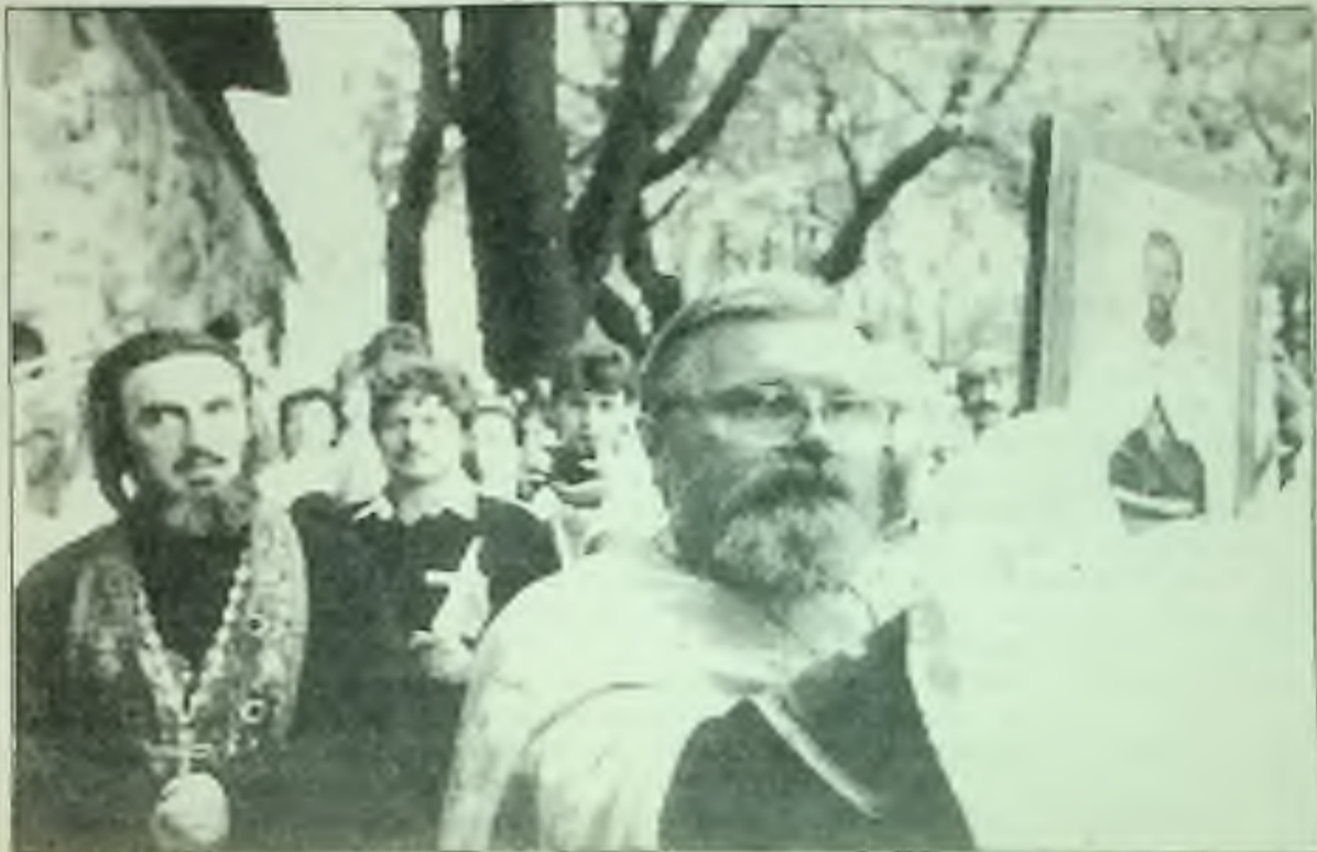
Truchlící se zúčastnili prvního veřejného rekviem (zádušní mše) v Sovětském svazu za cara Mikuláše II. v moskevském klášteře.

Američané si potrpí na stručné tituly a tak je tu třeba vysvětlit asi toto: Spojené státy přislíbily napomáhat vývoji k demokracii v Sovětském svazu a v zemích východní Evropy tím, že jim poskytnou určité výhody pro usnadnění hospodářských a politických reforem. Koncepte politiky vlády prezidenta Bushe je taková, že všechny tyto země nelze házet do jednoho pytle, že je k nim třeba přistupovat diferenciovaně, podle toho, jak poctivý a nadějný je v nich proces demokratizace. Země takzvané sovětské sféry vlivu se už tak automaticky nepovažují za sověť- Pokrač. na str. 6