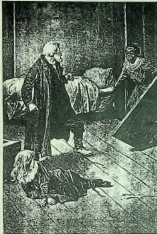
„Ano, ano! Ella zde, paní!“ zahřměla černoška. (Str. 183.)

„To není dědeček — ne — ne — oklamali mne — To je lupič a zločinec — utekl z vězení — ze Sibíře — je to velice zlý člověk. — Chtěl zavraždit“