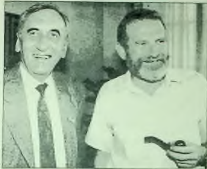
Poradce Solidarity Tadeusz Mazowiecki (vlevo) a zástupce Solidarity Bronislaw Geremek v parlamentě ve Varšavě v pátek, minulý týden