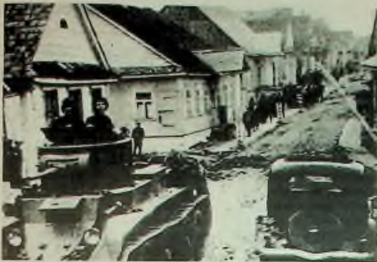
Sověti napadli východní Polsko po podepsání paktu a nacisté vpadli ze západu