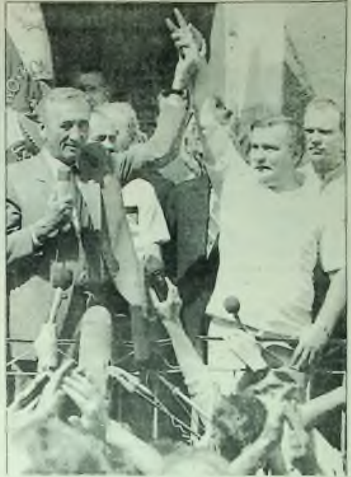
Lech Walesa (vpravo) a budoucí ministerský předseda Tadeusz Mazowiecki před zástupcem stoupenců v Gdaňsku.