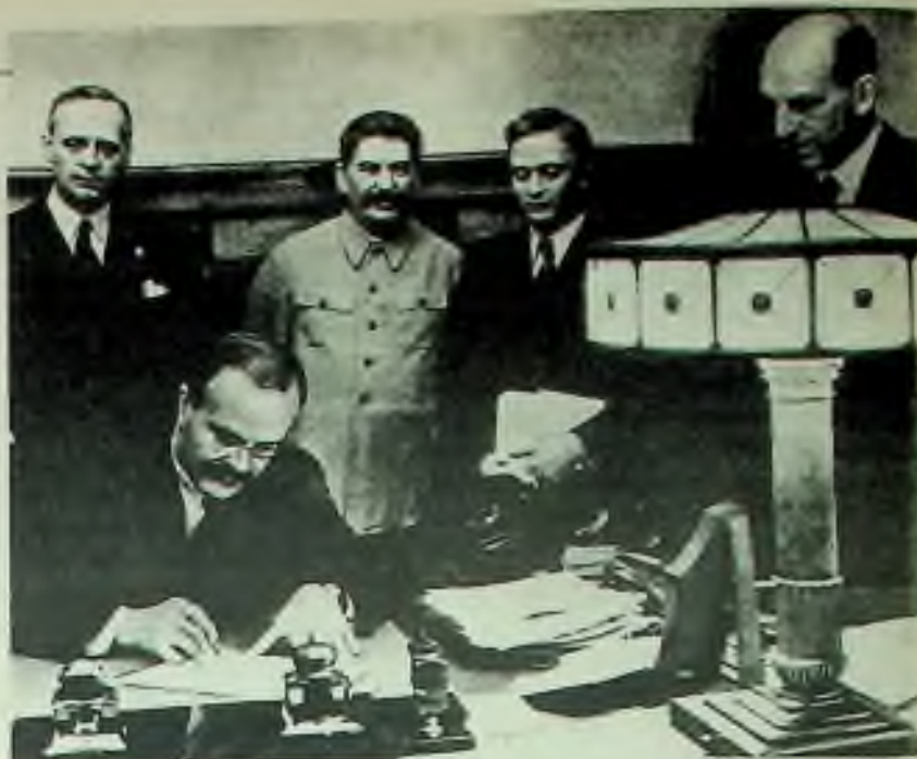
Molotov podepisuje úmluvu a von Ribbentrop (vlevo) a Stalin, mezi jinými, přihlížejí