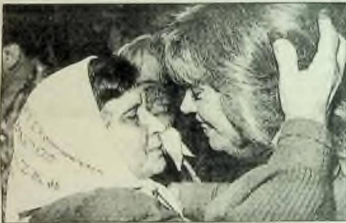
Americkou herečku a aktivistku Jane Fonda (vpravo) zdraví reprezentantka skupiny pro lidská práva, 'Matky z Plaza de Mayo' v Buenos Aires. Fondová tam byla na premiéře svého filmu 'The Old Gringo'.