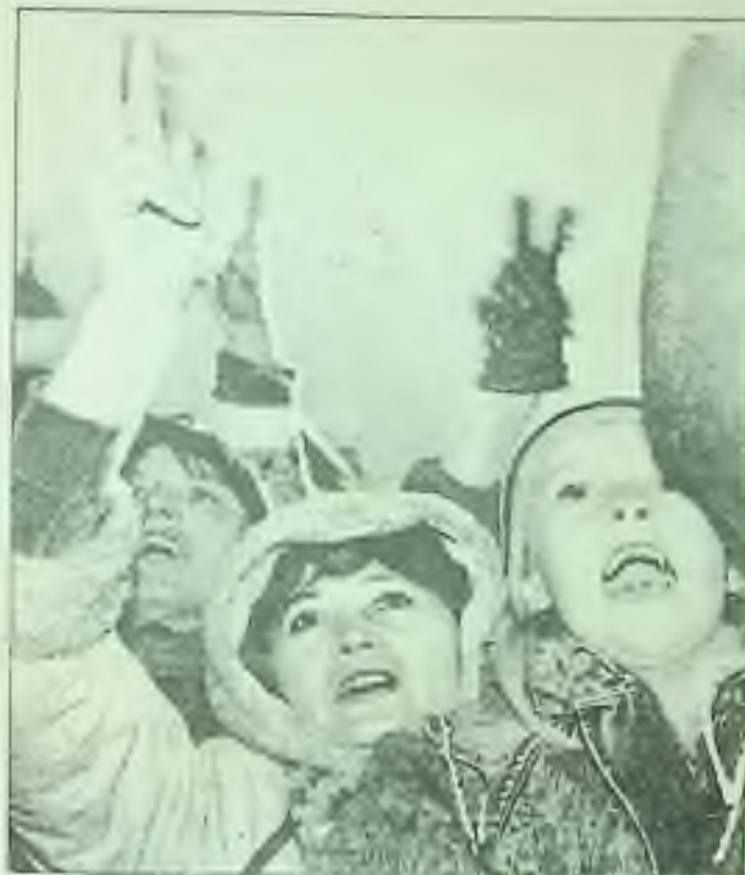
Tisíce se shromáždily v pátek v Bratislavě k oslavě vládního rozhodnutí, že se v pondělí začnou odbourávat opevnění z ostnatého drátu podél některých částí československých hranic