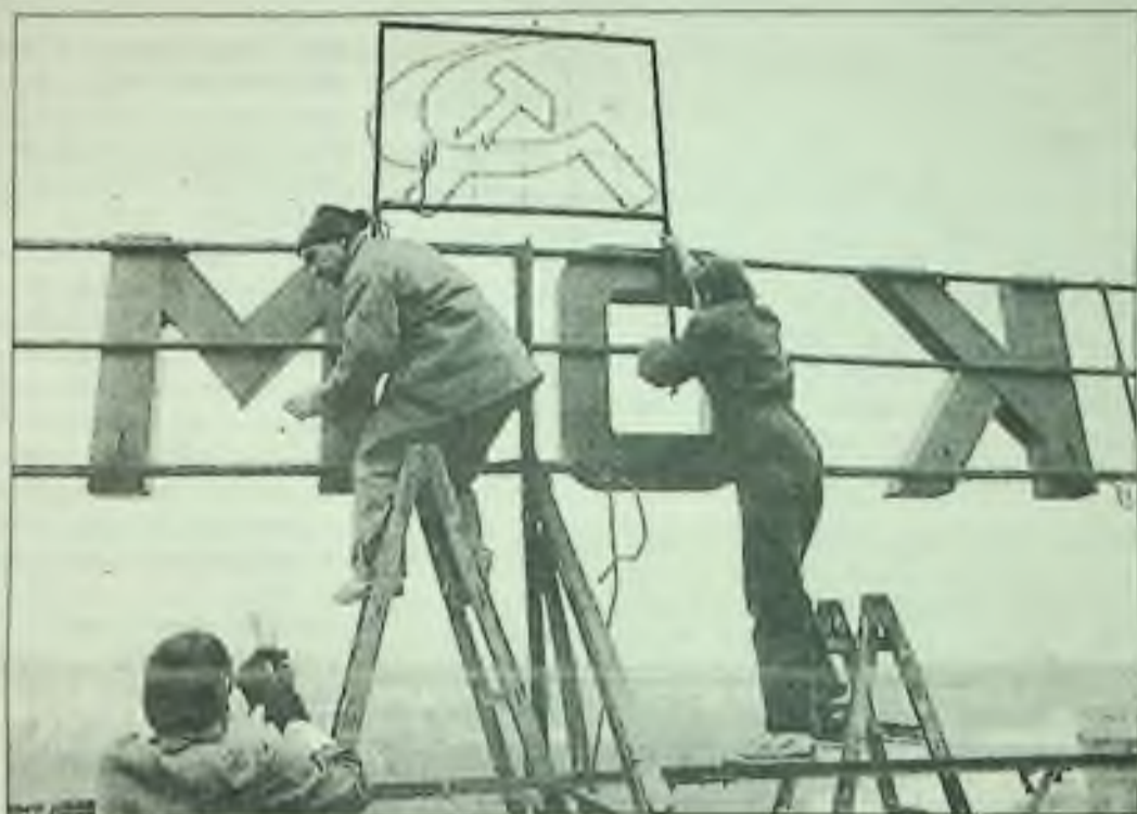
Dělníci odstraňují srp a kladivo, symbol komunistické strany se střechy ústředí elektrického podniku v Praze. Mnoho takových návěští se odstraňuje následkem zmenšující se role komunistické strany