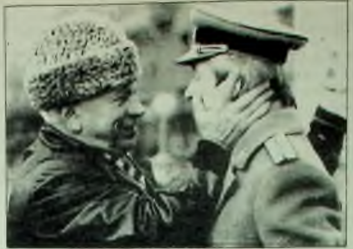
A civilian embraces a Romanian army officer Monday in Timisoara, seat of the country's revolt. Many residents reportedly remain in hiding as secret police continue firing at people in the street.

armáda, která se přidala na stranu lidu, ale již kontroluje hlavní body města a má v rukách i venkov. Ztráty na lidských životech jdou do tisíců; počet mrtvých se odhaduje na 6000 podle vyjádření zahraničních diplomatů a mediků. Ve městě Timisoara byli zraněni dva američtí a dva evropští novináři a americké velvyslanectví v Bukurešti evakovalo některé členy velvyslanectví a rodinné příslušníky zaměstnanců do Bulharska. Spojené státy i Sovětský svaz uznaly provisorní rumunskou vládu, kterou vede Ion Iliescu, který prohlásil, že nová vláda zřídí jinou strukturu politické moci a připraví do dubna svobodné volby. Iliescu sám je dlouholetým komunistickým pracovníkem, který ale upadl v nemilost, když byl v roce 1971 zbaven místa oblastního generálního tajemníka strany a vyloučen jak z Ústředního výboru strany, tak i z vlády. Říká se, že je i blízkým přítelem Michaila Gorbačova. Jinak Spojené státy vyjádřily politování nad tím, že soud s Ceausescem nebyl veřejný. Rečníci hovořící k shromáždě-