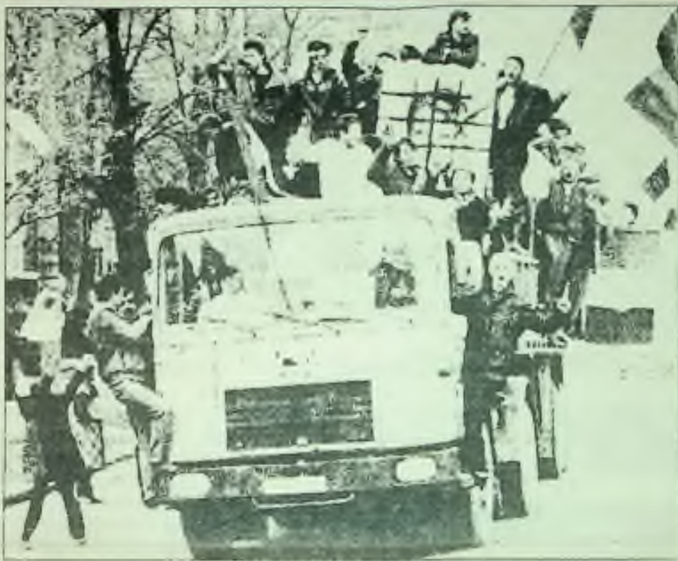
Carrying a portrait of ousted President Nicolae Ceausescu behind bars and the Romanian national flag, young Romanians demonstrate in the streets of Bucharest on Monday