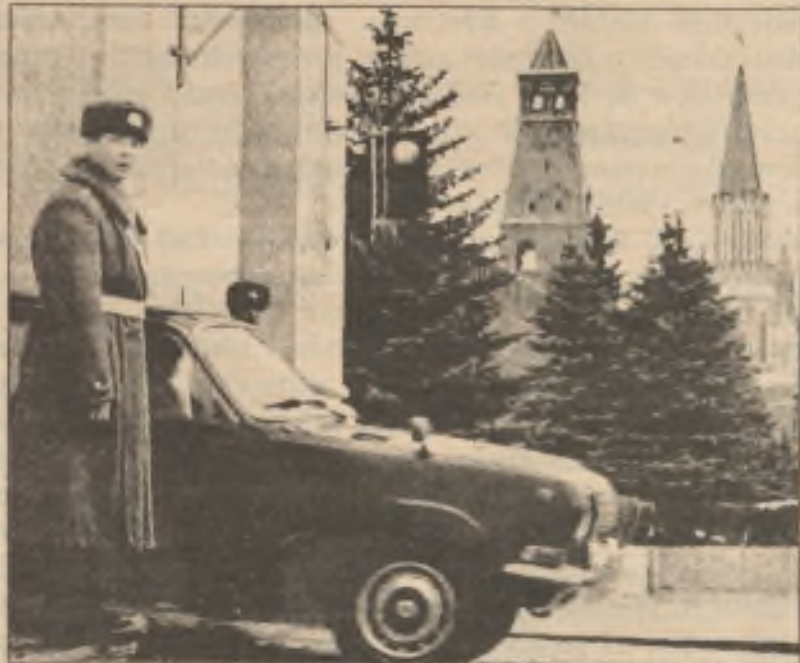
Černé auto značky 'Volga' se zataženými záclonkami odjíždí od vchodu do Kremle 'Spazskaja'; tam v pondělí začla plenární schůze Ústředního výboru