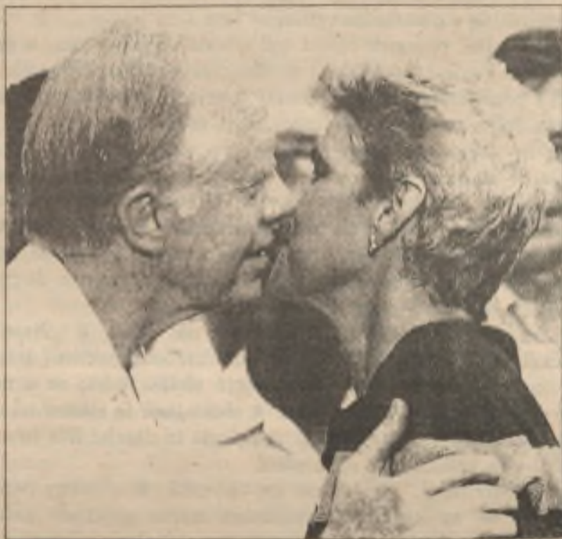
Bývalý prezident Jimmy Carter, který měl v neděli sledovat volby v Nikaragui, zdraví kandidátku opozice Chamorro v Managui

novinářům v Milovicích, kde se nachází hlavní vojenský stan sovětských okupačních armád, také řekl, že v průběhu tří fází stahování vojsk bude z republiky odvezeno 77 bojových letadel a 146 helikoptér. Odchod vojsk skončí podle plánu koncem roku 1991. V Československu se nachází 73.500 sovětských vojáků, kteří mají k dispozici tisíce tanků a obrněných vozidel.