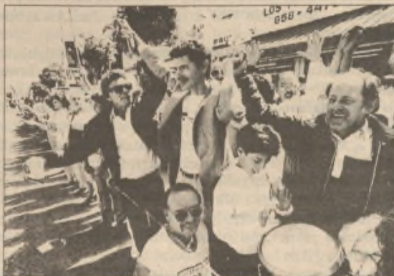
Kubánští exulanti v Miami na Floridě protestovali proti Fidelu Castrovi 'demokratickým řetězem' lidských rukou