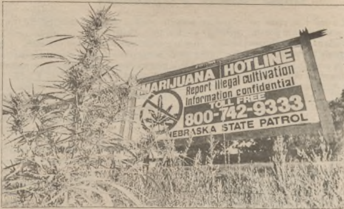
Poličko marihuany bují v Red Cloud, Nebraska, přes snahy státních úředníků vymýtit drogy. Nezákonní farmáři, zvláště na středozápadě USA, pěstují tisíce akrů obzvláště silné sinsemily

zvít'azí, lebo "pravda nemôže byť potlačená jeden krát a navždy, je to vždy dobové a krátke". Medzi absurdnosti prísnej kontroly režimu nad každodenným životom Dubčekovcov bol doprovod strážníkov pani Dubčekovej ku kadečníkovi a nevesty so synom do pôrodnice.