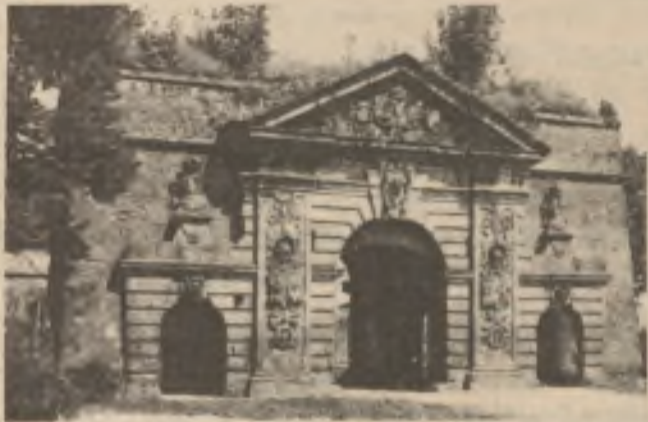
Terezká brána byla vystavěna v souvislosti s výstavbou pevnosti v roce 1752 jako náhrada za starou Střední bránu a ta byla v roce 1754 při příležitosti návštěvy Marie Terezie přejmenována na Terezkou. Po zrušení pevnosti byla ponechána jako památka a počátkem 40. let tohoto století byl v ní proražen boční vchod. Její předbrání tvoří již od roku 1895 vstup do Smetanových sadů. Náměstí před branou dnes Palachovo.

Papež Jan Pavel k nám přijede 21. dubna, a to na 2 dny. Bude sloužit mši sv. na Letenské pláni, Velehrad se upravuje pro milióny poutníků. Samozřejmě setkání s kardinálem Tomáškem, s arcibiskupem olomouckým a zavítá také do Bratislavy pozdravit tamější hodnostáře a věřící. Všechny biskupské stolce jsou obsazeny. V Olomouci se po prázdninách obnoví teologická fakulta, znovu bude umístěna na původním místě v Universitní ulici (do února '48 Ulice