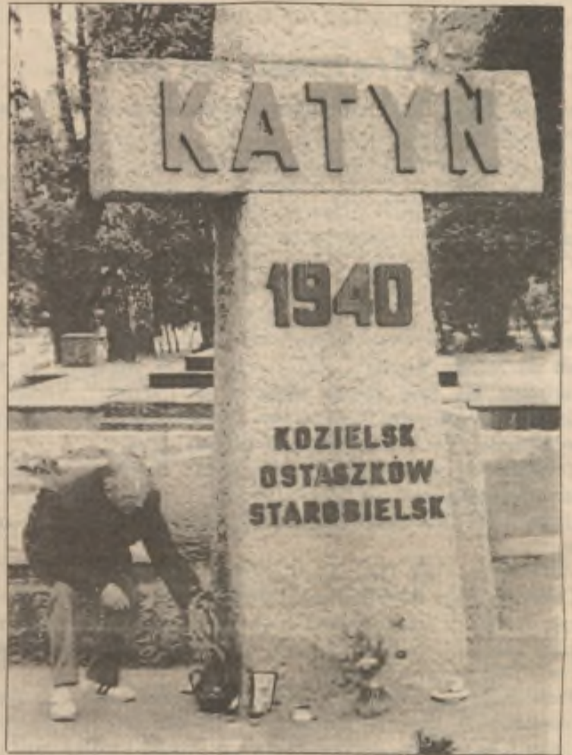
Muž pokládá květiny k památníku ve Varšavě Polákům, kteří byli zavražděni Sověty v Katyni v roce 1940.

Všimněme si toho, co o tom píše (5. února) politický analytik Pokračování na str. 7