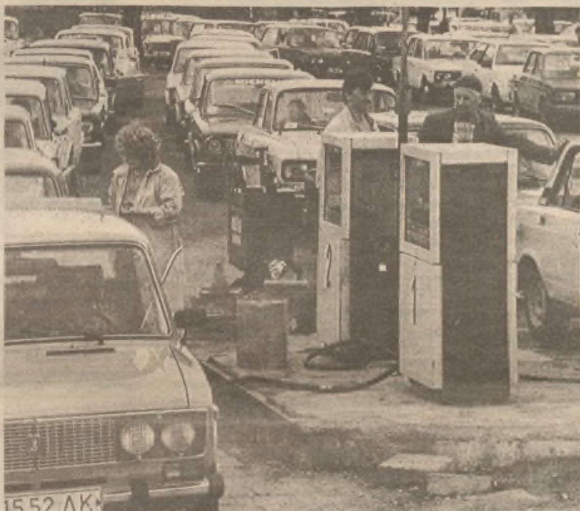
I přes prohlášení litvinských vůdců, že přijmou kompromis v otázce nezávislosti Litvy - obyvatelé Vilniusu nakupují benzin do zásoby - v očekávání ekonomických sankcí sovětských autorit.