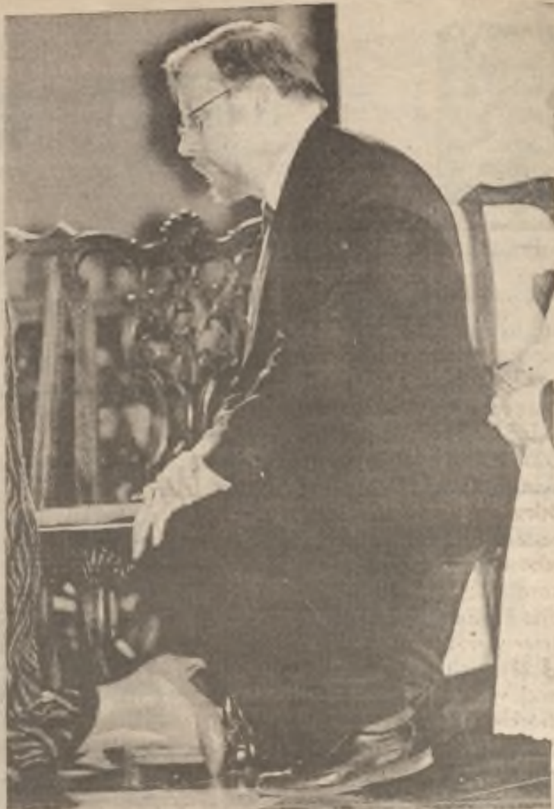
Litvinský prezident Vytautas Landsbergis na mši ve Vilně.

Národy upadají, když jejich vedení nemůže pochopit skutečnost a neuspěje v postavení se vůči změnám nebojácným způsobem. Toto je přesně dnešní situace ve Spojených státech. Vládase jen nepatrně angažuje ve všech záležitostech, ať již jde o zahraniční politiku, politiku obrannou či domácí hospodářskou politiku. V době, kdy země potřebuje něco podobného jako byl Manhattan Project, aby získala své technologické vedení, vládní činitelé uvažují jen o novém kole neplodných vyjednávání v zámoří. Lhostejnost, netečnost může být ale smrtící pro Spojené státy.