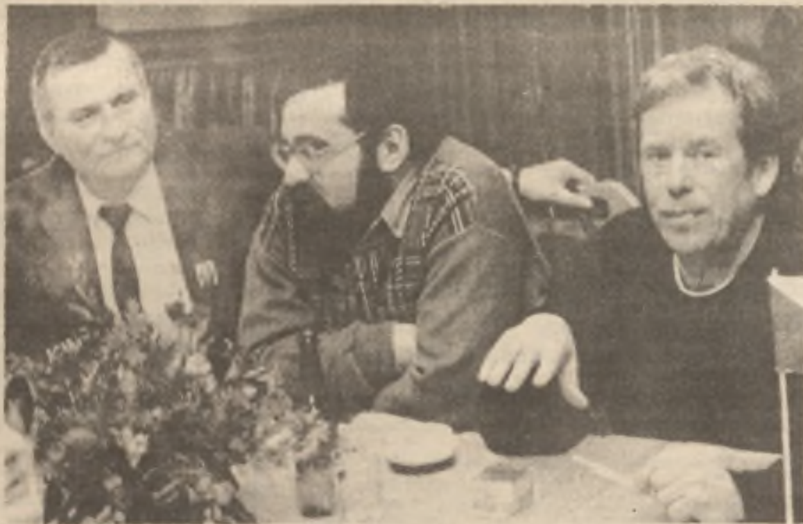
Vůdce polské opozice Lech Walesa a československý prezident Václav Havel o přestávce mezi osobním jednáním v Krkonoších (uprostřed tlumočnick - k čemu?) Účelem setkání bylo "koordinovat naše úsilí nejen pro demokracii a pořádek v našich zemích, avšak i pro náš návrat do Evropy v přátelském svazku svobodných národů a demokraticky nezávislých zemí." - My k tomu: Věříme vám, Václave Havle i bez vázanky.