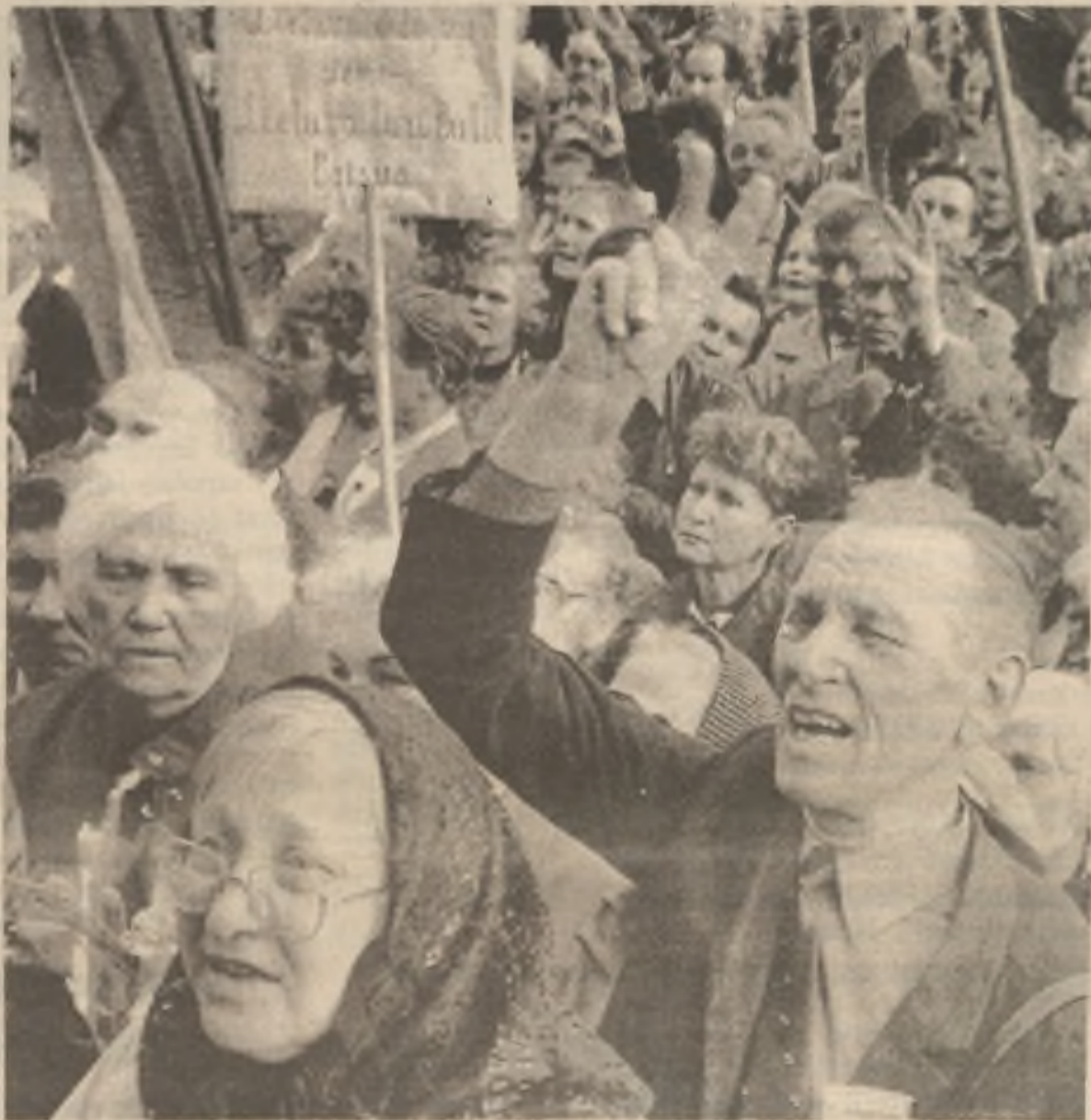
Po zvýšených ekonomických sankcích Sovětského svazu proti Lítvě - zastavením dodávek plynu - obyvatelé Vílniusu vyšli do ulic s nápisy: "Lítva je země hrdinů, Lítva musí být svobodná!"

V sobotu 21. dubna přijal na dvoudenní návštěvu Československa papež Jan Pavel II., který ještě na letišti vykonal přehlídku čestné stráže v doprovodu presidenta Václava Havla. Jak je papežovým zvykem, po vystoupení z letadla políbil zemi. V krátké řeči Svatý Otec uvedl, že komunismus se prokázal být tragickou utopií, protože popřel duchovní potřeby člověka, a že to bylo násilné aplikování materialistické ideologie, které parazitovalo národy východní Evropy. President Havel označil papežův příjezd za zázrak, že do země zničení ideologií nenávisti přichází posel lásky a že žijící symbol civilizace přichází do země zničené vládou necivilizovaných lidí. Na plni mši svaté na Letné mělo být podle odhadu přítomno přes půl milionu věřících. Na cestě z letiště do středu Prahy byl papež nadšeně a srdečně pozdravován statisíci věřícími.