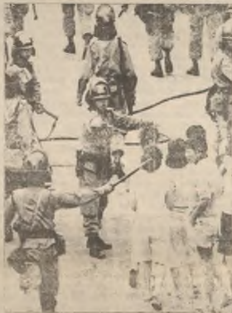
Násilnosti v uprchlickém táboře v Hong Kongu

Policie v Hong Kongu nařídila vietnamským "boat people" aby se vrátili do zadrhovacího tábora pro uprchlíky, když vypukly násilnosti již druhý den. Policie hledala doma vyrobené zbraně.