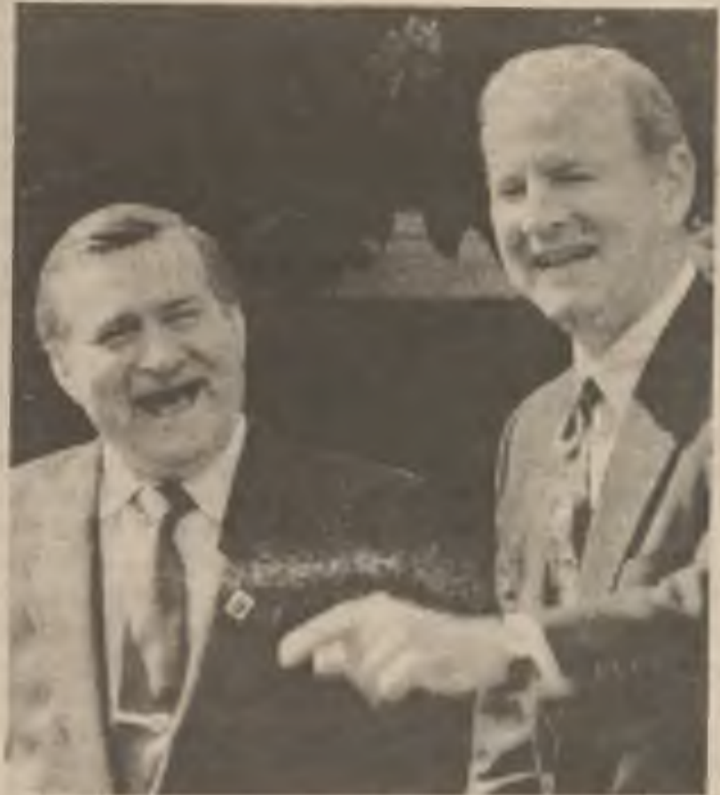
Státní tajemník James A. Baker s Lechem Walesou, vedoucím Solidarity, při jeho šestihodinové zastávce nedávno ve Varšavě.