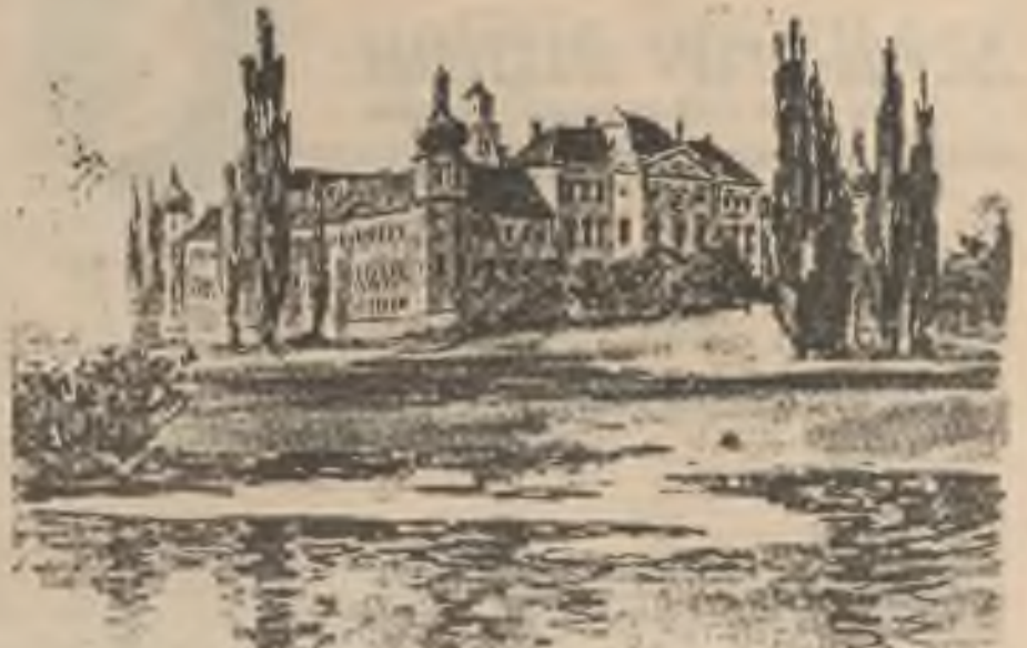
ZE STARE OLOMOUCE - Klášter Hradisko, 1899, barevný knihtisk, S. Lolek, R. Promberger, Olomouc.

... a Kopeček je zase Svatý. Z dopisu z domova. Březen 1990.