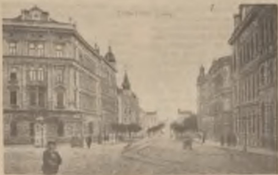
ZE STARE OLOMOUCE - Třída Františka Josefa, 1900. Tisk J. Werner, Olomouc.