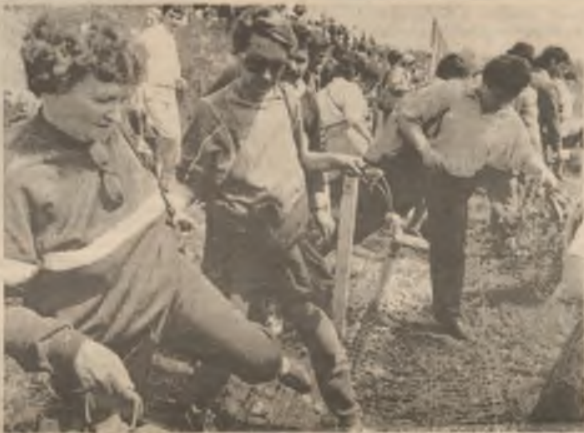
Sovětské autority otevřeli na jeden den hranici, která po desítky let rozděljuje Moldavii mezi Sovětský svaz a Rumunsko. Rumuni překročili hranici aby se setkali se sovětskými Moldávci.