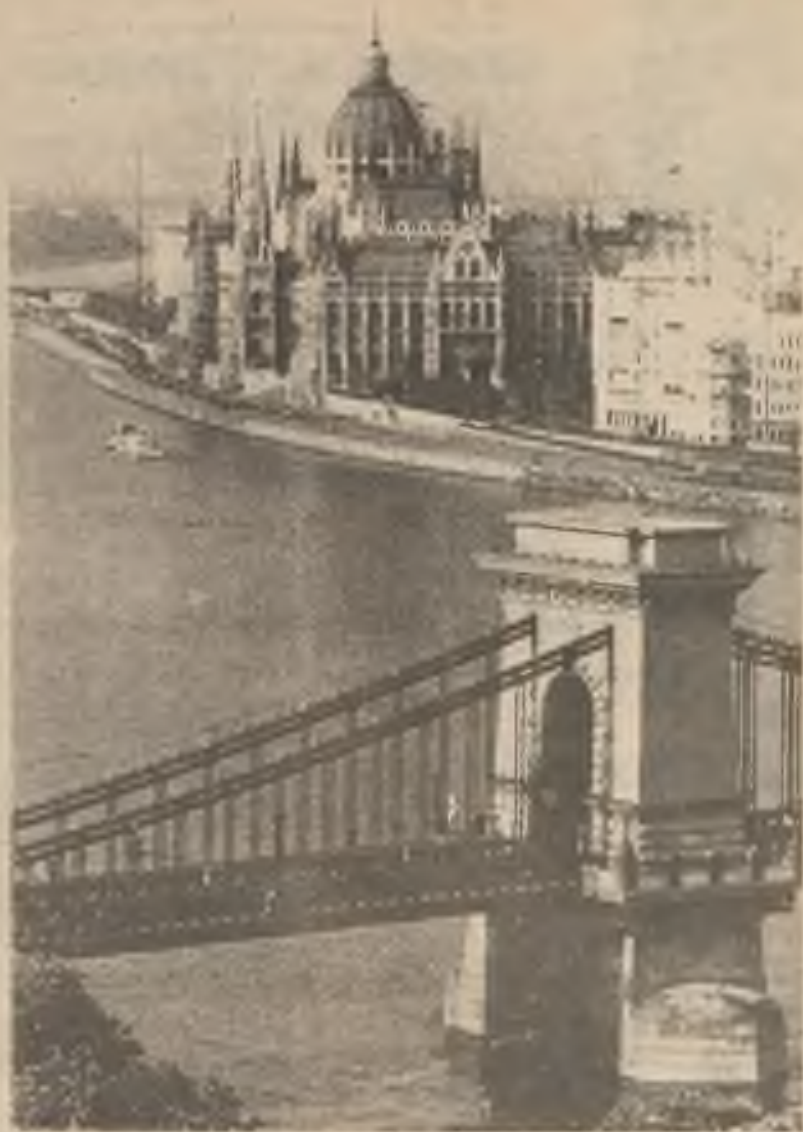
Zavěšený řetězový most a maďarský parlament okrášlují Dunaj protékající Budapeští. Po 2000 milích cesty se tato největší evropská řeka postupně zpomaluje při vlivání do Černého moře.

Jan Patočka dal ve smyslu onoho slavného textu, příklad mládeži i všem příslušníkům obce. Léta, která od té doby uplynula, potvrdila účinnost tohoto příkladu, a ve Václavu Havlovi našel svého pokračovatele. Hanba padá na hlavu jeho soudců, oněch mužů, kteří uvažovali o všem jiném, než právě o ní.