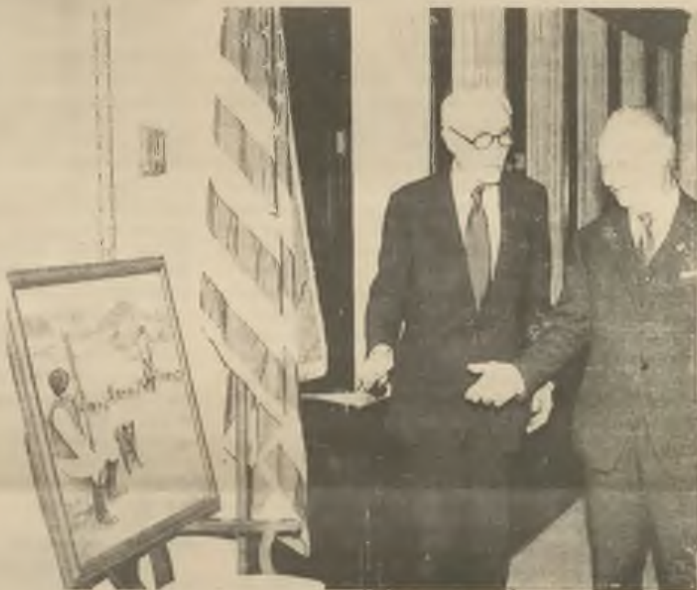
Alexandr Dubček, vpravo, vůdce Československého národního shromáždění, ve Washingtoně s senátorem Claibornem Pellem, předsedou senátního výboru pro zahraniční vztahy. Senátor ukazuje dar, který obdržel, když pracoval v Československu jako vládní úředník v Zahraniční službě.

Prezidenti tří baltských států - Litvy, Estonska a Lotyšska - se sešli na jednodenní vrcholné schůzce, která se konala v sobotu 12. května v hlavním estonském městě Tallinu. Dohodli se na obnovení politického svazku zvaného Baltská rada, který byl vytvořen v roce 1934 v době nezávislosti těchto republik. Baltská rada bude koordinovat politickou a ekonomickou politiku všech tří států, aby tak byla vytvořena jednotná fronta. Dohodu podepsal litevský prezident Vytautas Landsbergis, estonský prezident Arnold Ruutel a lotyšský prezident Anatoly Gorbunov.