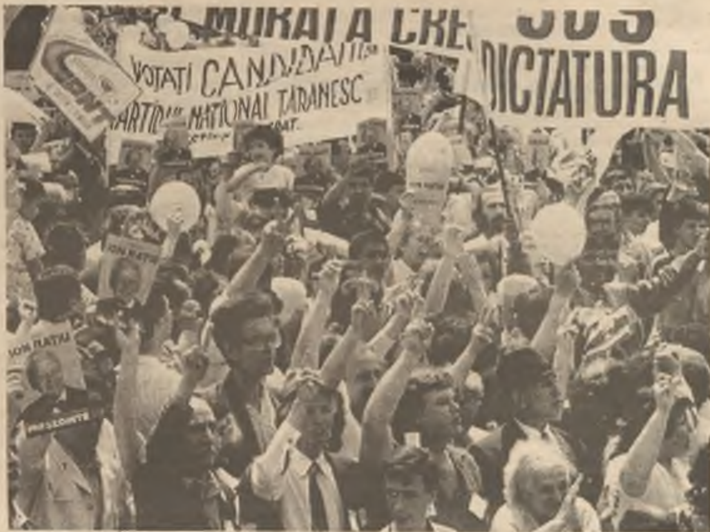
Při volební manifestaci v Bukurešti stoupcí opoziční rumunské Národní rolnické strany zdravili svého kandidáta.

President Bush navrhl v projevu k absolventům university South Carolina zřízení Občanského demokratického sboru (Citizens Democracy Corps), který by sloužil jako informační středisko pro americké dobrovolné programy na pomoc střední a východní Evropě. Středisko bude informační základnou pro technické služby a zařízení, jež mož-