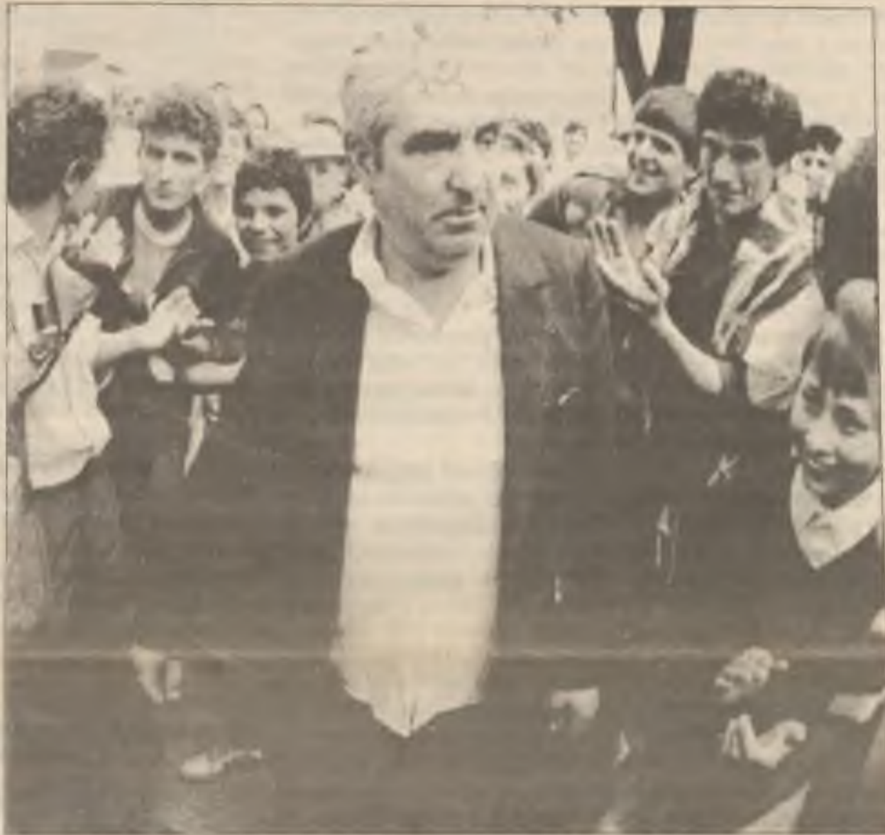
Muž, který byl označen za komunistu, je nucen projít posměvačným davem lidí v Bukurešti v Rumunsku minulou sobotu. Protlkominističtí demonstranti manifestovali v hlavním městě skoro po celý měsíc.