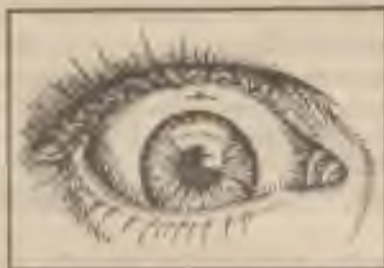
Dnes jeden steh