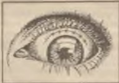
oproti dřívějším více stehům