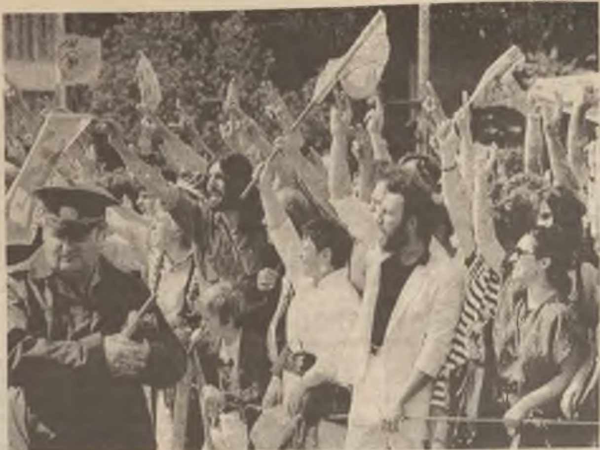
Vůdce opozice proti bulharské Socialistické straně řekl, že budou i nadále bojovat proti dřívějším komunistům, přes to že zvítězili v nedělních volbách. Desetitisíce zastánců opozice korzovalo po ulicích Sofie a demonstrovalo před budovou Národního shromáždění

Japonští výrobci automobilů spěchají do Evropy, aby nepřišli pozdě. Pronikají kde se dá, jakýmkoli způsobem. Tak firma Nissan otevřela svou evropskou základnu v malých panelových chatkách v Sunderlandu. Zde jsou na rýsovacích prknech připravovány plány pro první japon-