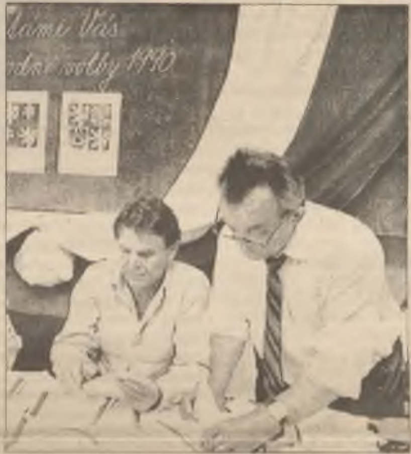
Úředníci počítají hlasy v pražské škole v neděli po prvních parlamentních volbách v Československu od roku 1946