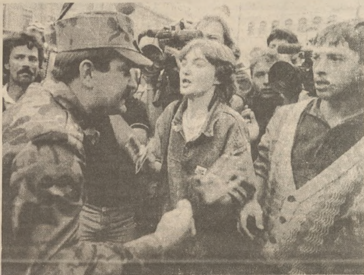
Důstojník argumentuje s demonstranty na Universitním náměstí v Bukurešti.

Protikomunističtí demokraté se vrátili na hlavní náměstí v Bukurešti, kde minulý týden policie a horníci, loyální rumunskému prezidentu Ilescu, zbili lidi, aby rozehnali demonstrující. Asi sto lidí vykřikovalo hesla proti Ilescu, zatím co vojáci s klackami v rukou, hlídali. Dav se začal rozcházet po té, kdy nový ministr vnitra nabídl začátek dialogu.