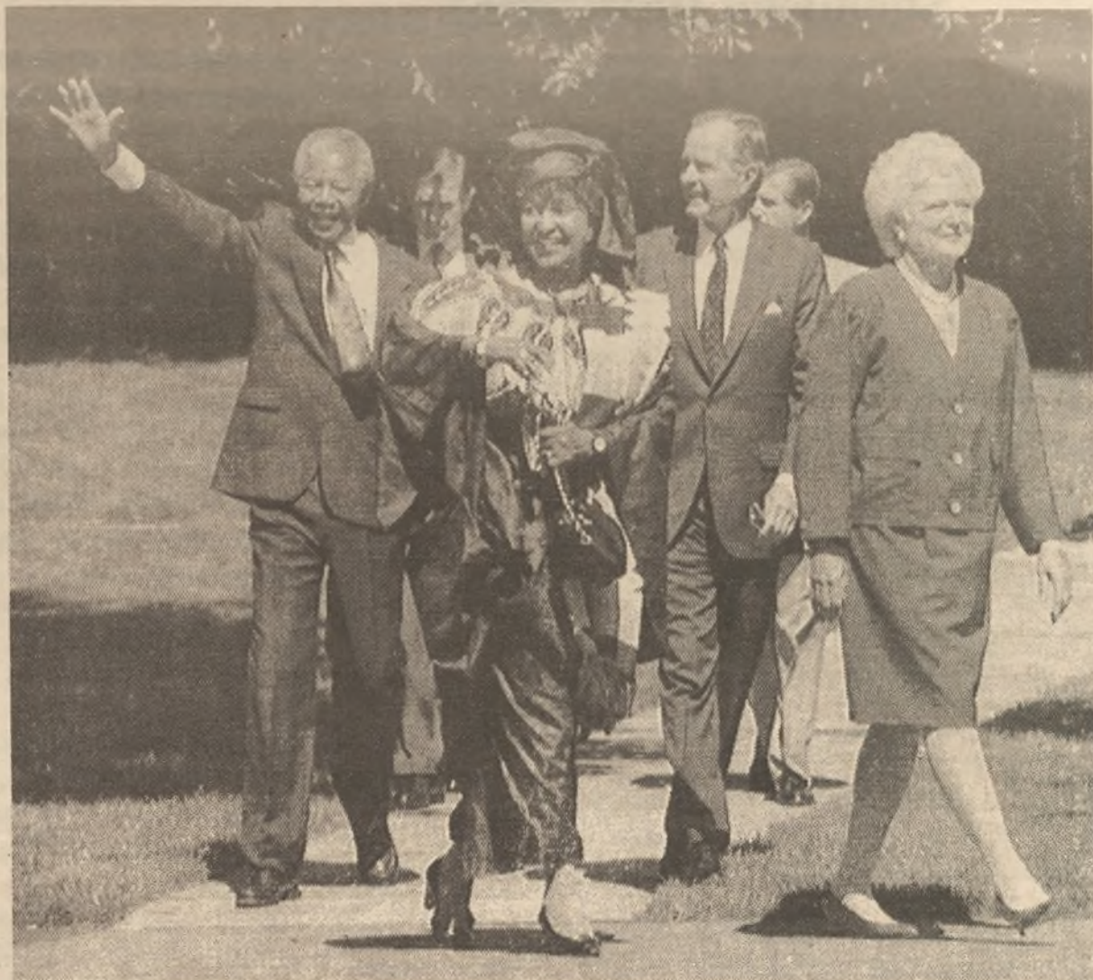
Prezident Bush a jeho žena Barbara s Nelsonem Mandelou a jeho ženou Winnie v Bílém domě

Výnos a rozhodnutí Nejvyššího soudu Spojených států ve věci potratů rozšíří mezeru v národě. To je mínění zkušených odborníků v hlavním městě Unie. Předmětem přítomné kontraverze je spor, zda nezletilí musí si vyžádat svolení rodičů, či jen jednoho z rodičů k tomu, aby mohli mít potrat. Jde jen o další záležitost, která se stane předmětem nastávajících voleb. Svůj klobouk hodila do ringu i Americká asociace právníků, která se připravuje k rozhodnému kroku na své konvenci v srpnu v Chicagu. Podobné rozmišce z kontraverzního případu čelí AFL-CIO, jejíž