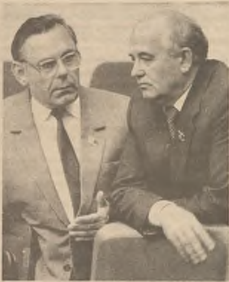
Gorbačov a Ivan Poliznikov, první sekretář Ruské komunistické strany, debatuji o přestávce třetí den zasedání kongresu komunistické strany, na kterou byl Gorbačov podroben přísné kritice. Jeho podporovatelé říkají, že mnozí vedoucí stran jednotlivých republik jsou loyální Gorbačovovi.

Někteří demokraté odporují této nové dani a říkají, že je 'regresivní', to znamená, že má 'zpětnou