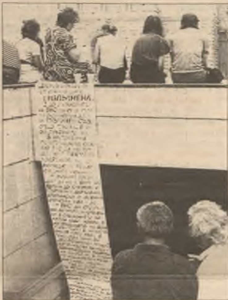
Seznam požadavků odpůrců komunizmu v Bulharsku.

Požadavky protestujících Bulharů byly vyvěšeny u vchodu do podzemní dráhy v Sofii. Protestující žádají demokratizaci a vyšetření činnosti starého komunistického režimu.