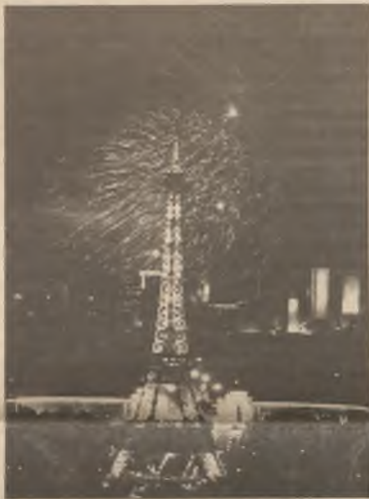
Ohňostroj vybuchl v blízkosti Eiffelovy věže v Paříži počas oslav 201. výročí pádu Bastille vězení, který vyvolal Francouzskou revoluci.

S tím se veřejnost může - dost dobře - smířit. Pokud ovšem - a to je prostor pro domácí sdělovací prostředky - učiní ministerstvo vnitra pod novým vedením všechno pro to, aby občanům vrátilo důvěru k bezpečnostním složkám státu.