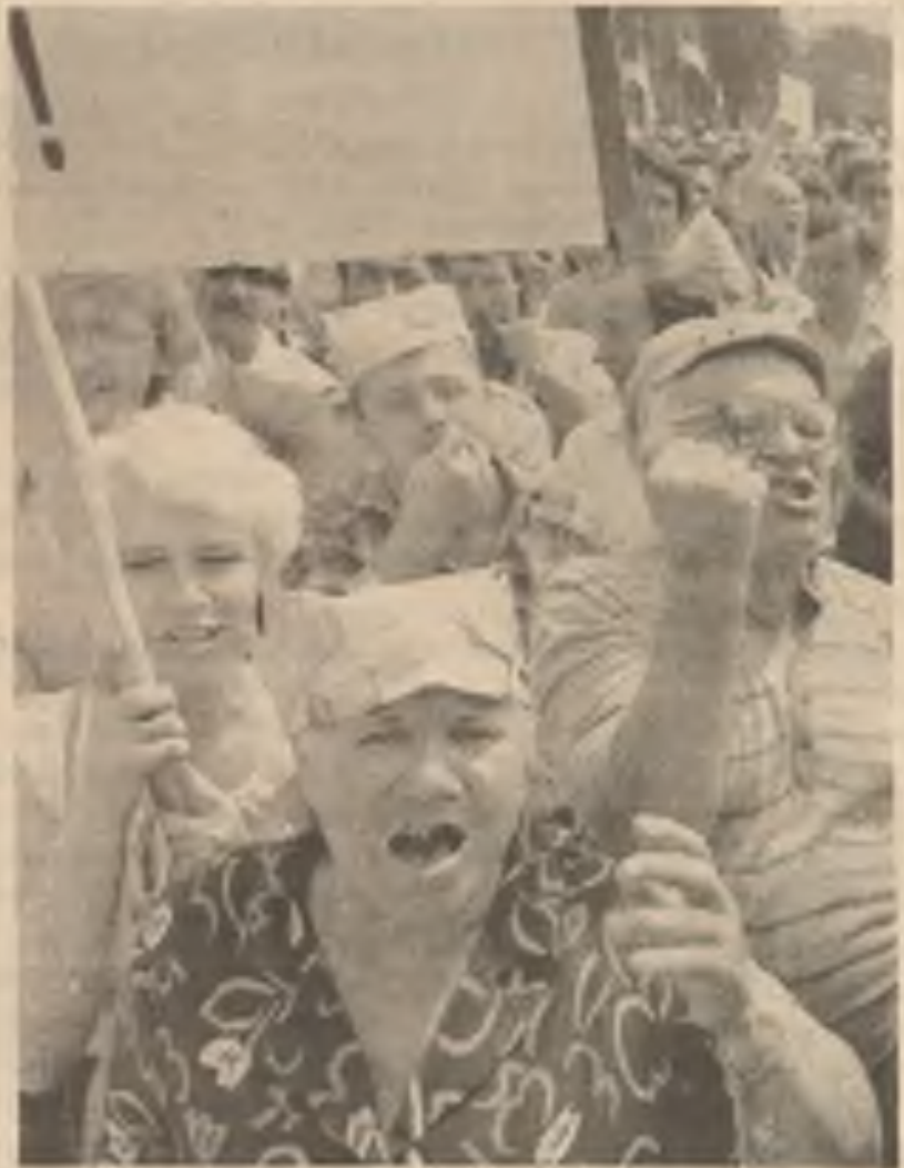
Horníci v Donets, U. S. S. R. , protestovali v celonárodní stávce pro dosažení větší moci v práci.

Dle vyjádření Alana Greenspana, předsedy Federální rezervní