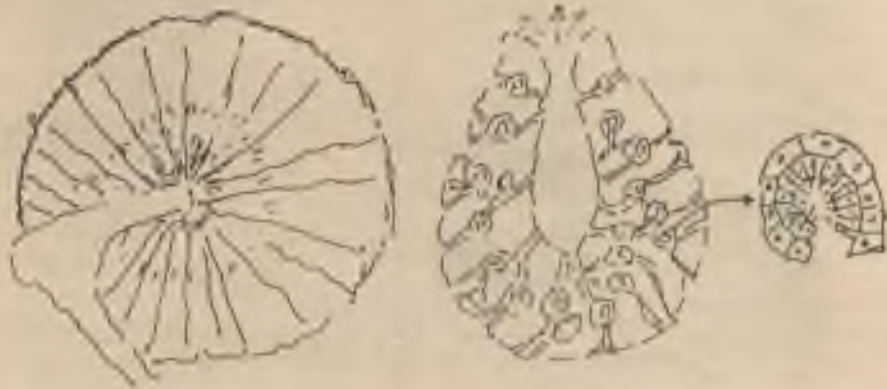
Houba Coprinites Dominicana

Houbami jsou ale i sladkovodní a mořské houby, které jsou v podstatě jednoduché (vytvořené) zvířecí kolonie (u mnoha druhů nebyla dlouho jistota, zda jsou to rostliny či zvířata). Sladkovodní říční a jezerní houby žijí v symbióse s řasami; proto jsou na povrchu zelené. Usazují se na vodních rostlinách či na kamenech a p. Mořské houby jsou 'vylovovány' z moře a od starověku používány jako čistící houby při koupání a umývání. Jejich tělo tvoří kolonie mořských jednoduchých