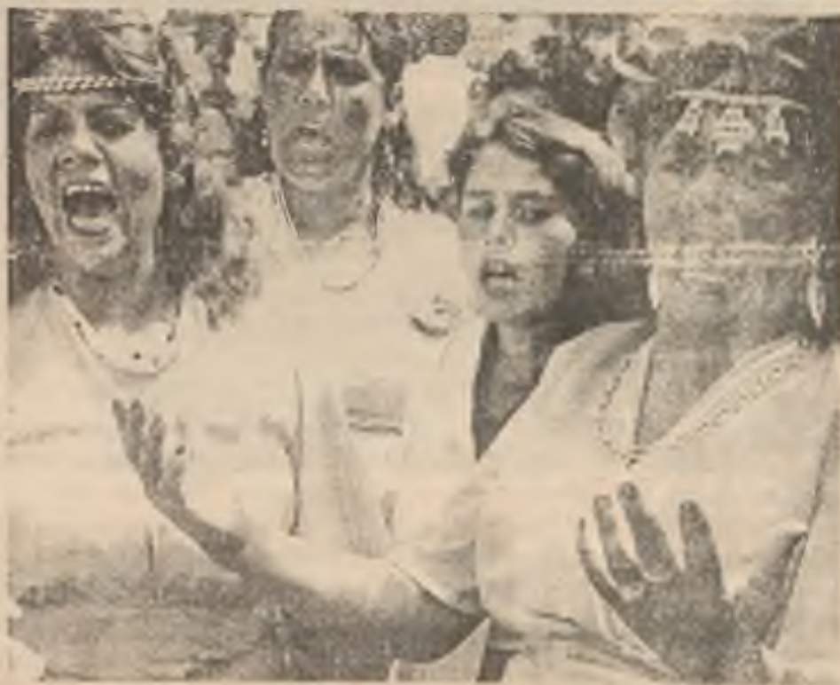
Vúdcové cikánů říkají, že nepokoje ve východní Evropě přinesly s sebou vlnu prot cikánského citění. Cikánské ženy zpívaly návštěvníkům mezinárodního cikánského festivalu v Brně, na Moravě.