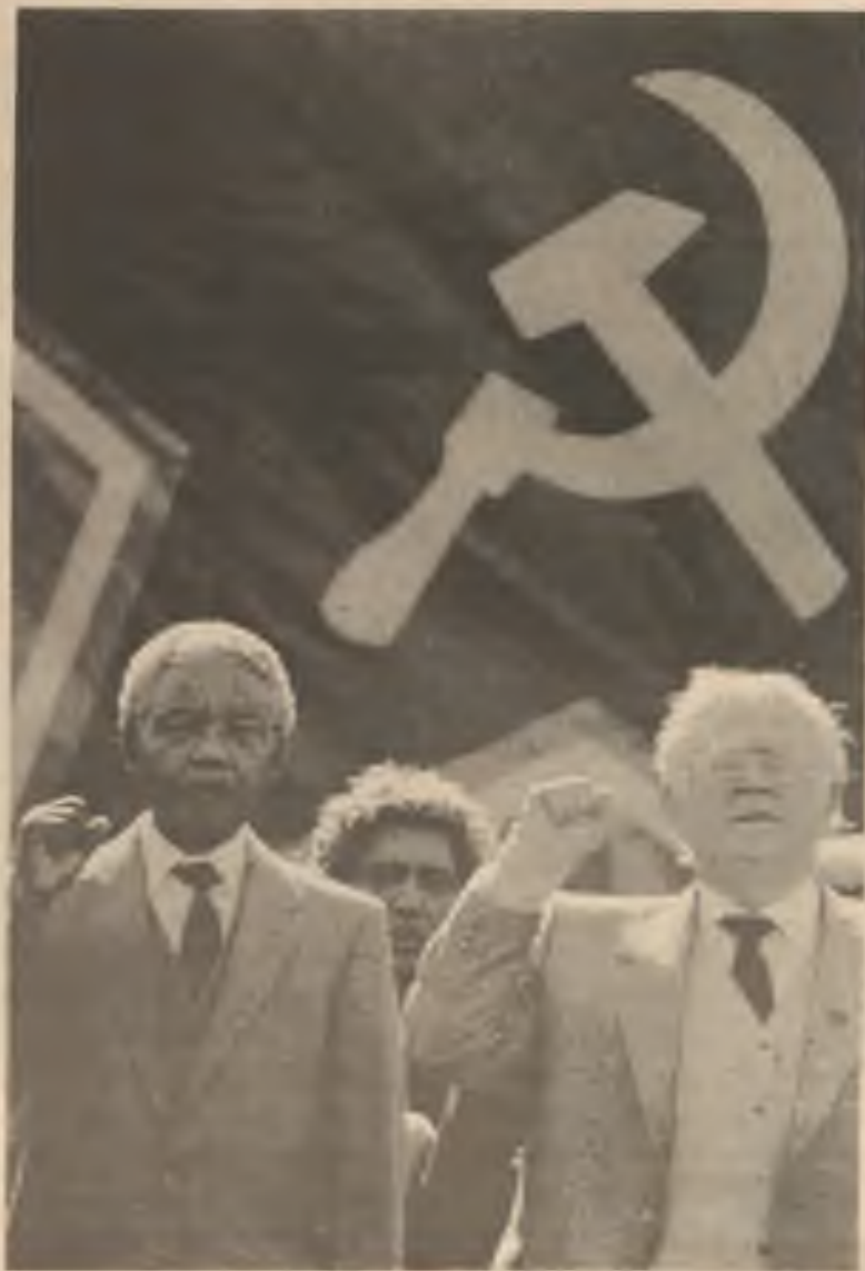
Nelson Mandela, vľavo, vůdce Afrického národního kongresu, a Joe Slovo, hlava jihoafrické komunistické strany na sjezdu, prvním na veřejnosti od doby před čtyřiceti lety, kdy byla taková shromáždění zákonem zakázána.

Východonemecké zdroje hovoria o štyroch miliónoch, takmer polovici všetkých pracovných síl. Západní investori, do ktorých mnohé podniky vkladali nádeje, sú podozrivo nečinní. Regine Hildebrandtová je presvedčená, že situáciu pomôžu vyriešiť iba obrovské investície Bonnu. Už dnes je v zálohe pripravených 70 miliárd mariek, ktoré podľa internej nemeckej zmluvy majú pokryť deficit, penzie a podpory pre nezamestnaných. Západné Nemecko sotva bude môcť existovať s bremenom tejto zanedbanej a zdevastovanej časti krajiny. Má iba dve možnosti. Investovať, alebo čeliť masívnej nezamestnanosti, spolu so všetkými jej neželateľnými následkami. Navyše - nikto nemôže predpovedať budúcnosť krajiny, ktorej dni sú už spočítané. Podobný proces nemá totiž v histórii obdobu.