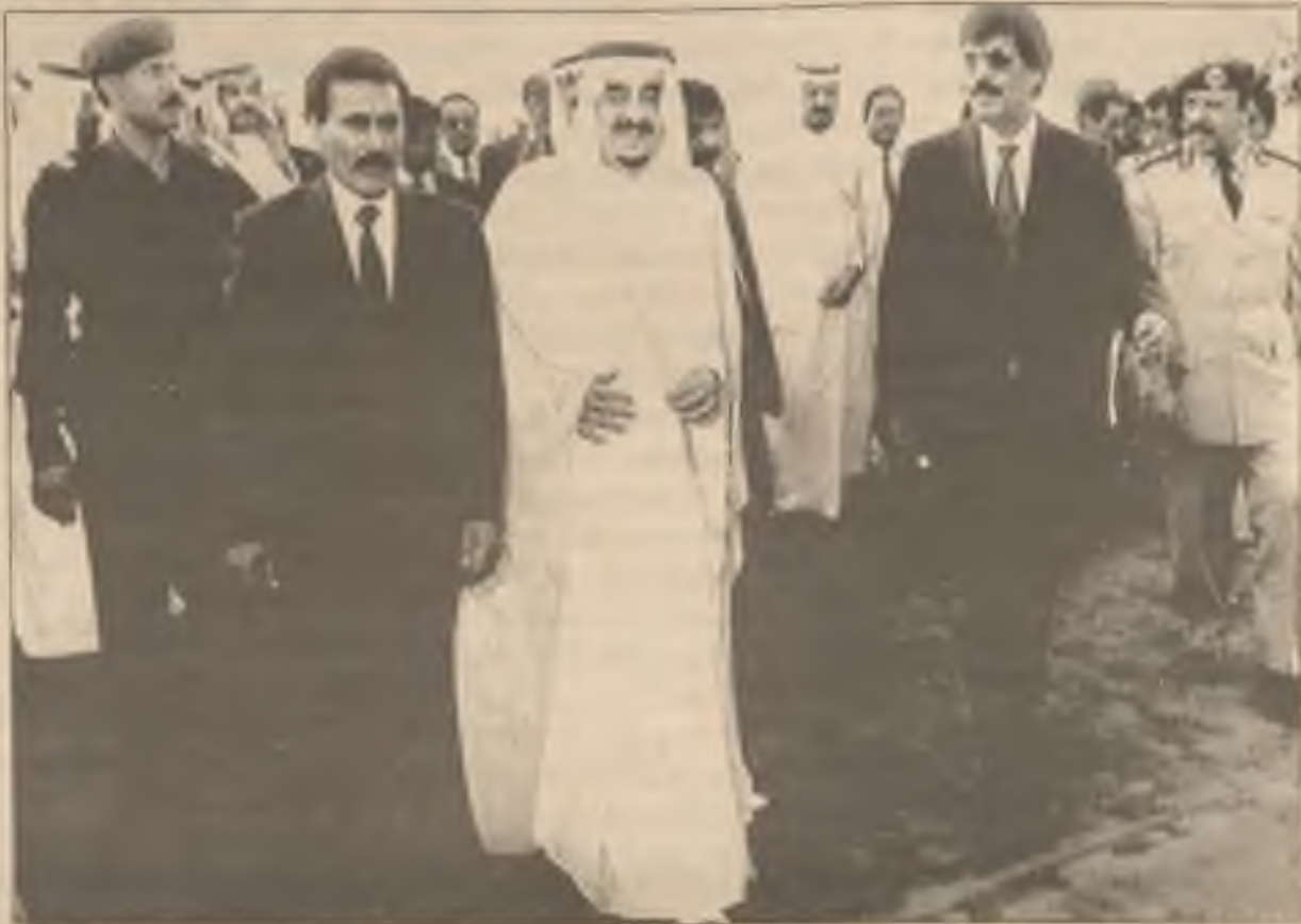
Král Saudské Arabie Fahd (uprostřed) doprovázel v sobotu prezidenta Jemenu Ali Abdullaha Saleha v Jidda, Saudi Arabie, po schůzce jemenského vůdce Saddamem Husseinem v Iraku.