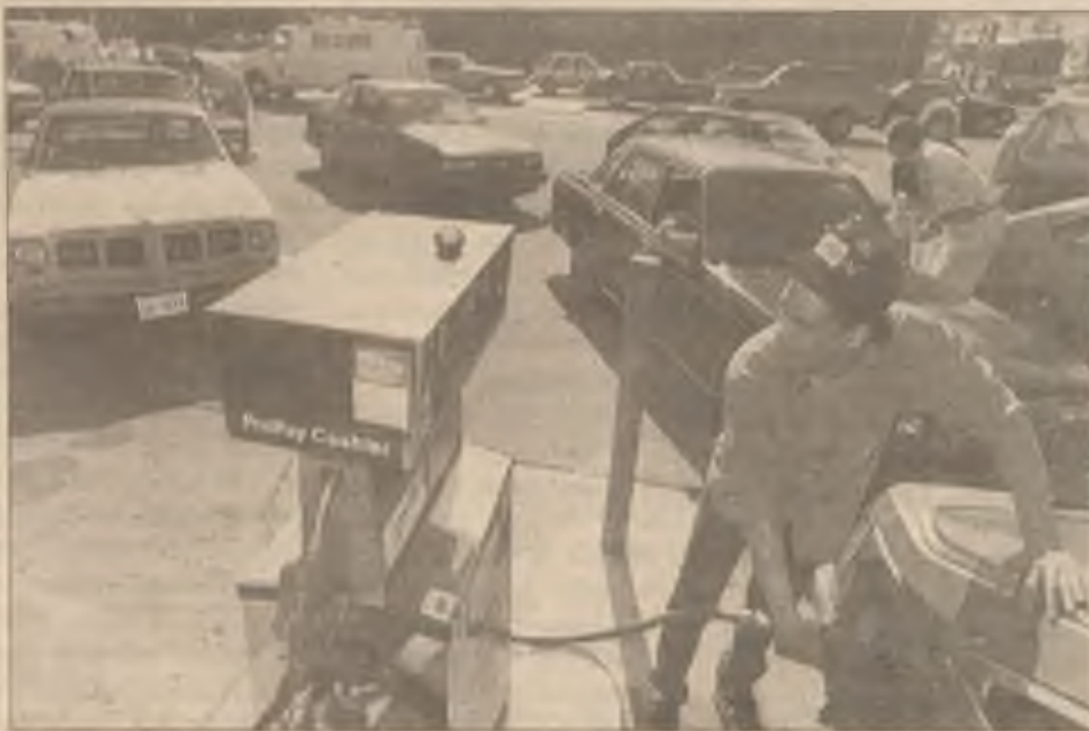
Ve čtvrtek stála auta v dlouhých řadách u jedné gasolinové stanice v předměstí Chicaga, kde byla cena 89 centů za galon. Američané jsou nejvíce naladěni tím, co se týká jejich auta, řekl Gerald M. Cheske, mluvčí Americké automobilové Asociace. A v mnoha případech je motorista rozzlobený.

Zvýšení cen benzínu vyvolalo takovou vřavu, že nepředpokládané se stalo skutkem. Phillips Petroleum snížila cenu benzínu ve velkém o 4.5 centů na galon a Arco stabilizovala ceny na dobu jednoho týdne. Prezident Bush požádal benzinové firmy, aby se zdržely dalších zdražování. Rezervy oleje, připravené na podobnou událost zůstaly zatím netknuty. Jedním z hlavních jejich účelů je vyrovnávat eventuelní zvýšení cen způsobené nedostatkem pohonných látek. Uvolnění částí této rezervy by mělo zabránit spekulativním operacím. Ceny oleje ve velkém zatím klesly asi o 3 dolary na sud po zprávě, že Saudská Arabie a ostatní jsou připraveny zvýšit těžbu. Ale ani toto zvýšení těžby nemůže vyrovnat ztráty dodávek oleje z Kuwaitu a z Iraku.