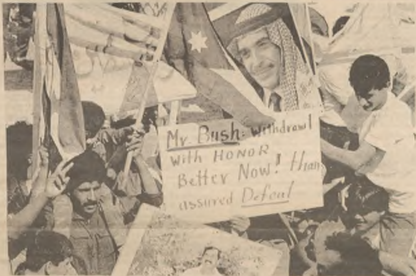
Jordánci demonstrují v Amfagaq, Jordan; naléhají na Spojené státy, aby odešli ze Saudské Arábie. Společnost národů uvalila na Irak obchodní sankce v odvetu za okupaci Kuwaitu, nezačal ještě blokovat lodní zásilky do Iraku přes své území.