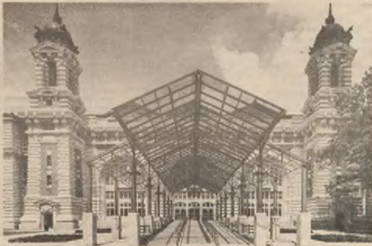
Ellis Island bude příští měsíc znovu otevřen jako muzeum přistěhovalectví. Po renovaci, která trvala 8 let, ozdobná hlavní budova na Ellis Island v New York Harbor se má otevřít pod názvem Ellis Island Museum of Immigration.

Sovětská vláda porušila jednu z hlavních zásad marxizmu a socializmu vůbec: zrušila zákaz soukromého vlastnictví a oznámila, že dovolí jednotlivým občanům a skupinám, aby si založili malé podniky. Zatím ovšem jen malé, ale všechny velké podniky dneška vyrostly z těch malých, z operací jednoho muže, který měl visi schopnosti, chut' k práci a ovšem také to štěstí. Toto rozhodnutí je jedním z posledních tahů sovětské vlády jak zachránit zemi před hladem a krvavou revolucí. Velký Lenin se neobrátí ve svém hrobě na Krasnoj Plosčadi. Proč by se také obracel? Vždyt' tato 'nová' vymoženost není ničím novým, je to jen ta stará, Leninova NEP - Novaja Ekonomičeskaja Politika! Ten starý trik, který ve dvacátých letech zachránil na určitou dobu život Sovětského svazu, dnes Gorbáčovu zachraňuje jeho vlastní fyzický život.