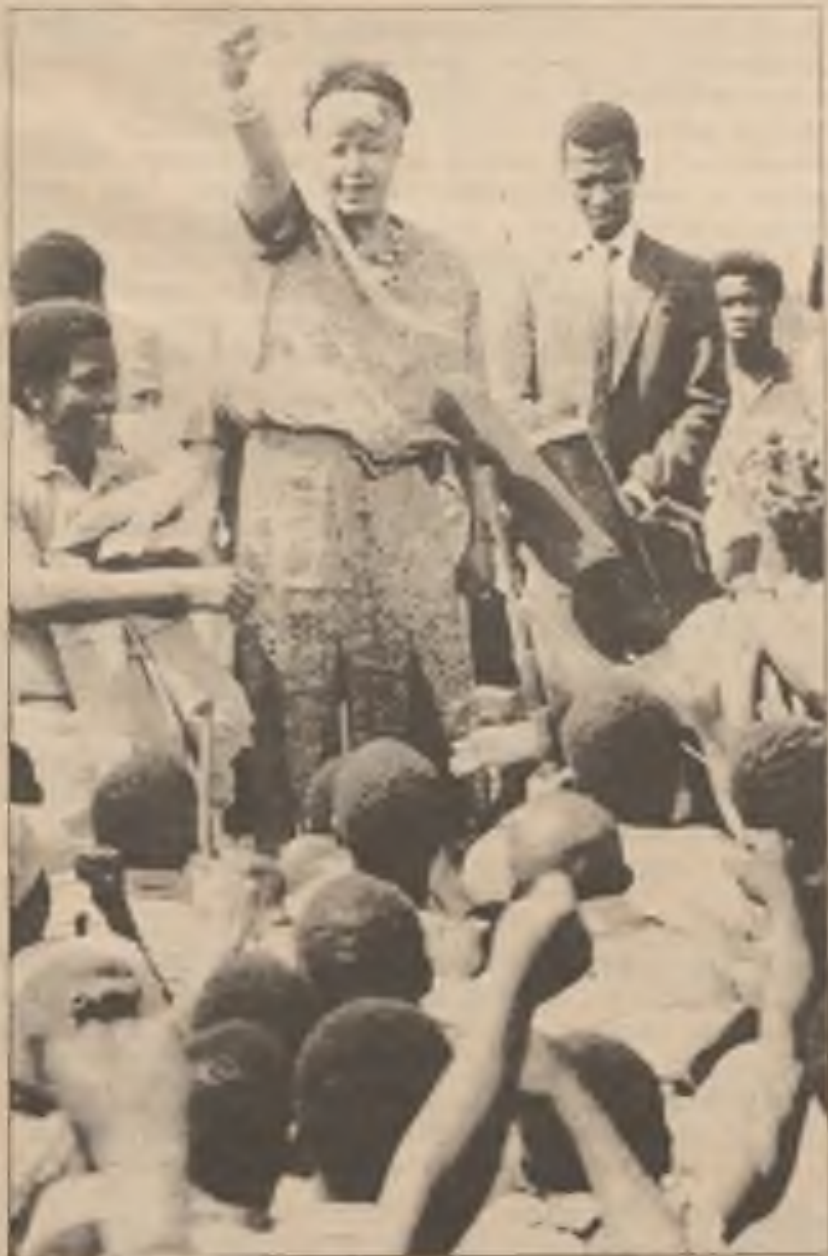
Winnie Mandela, žena Nelsona Mandely z ANC, zdraví osadníky spory rozštěpeného Phola Parku v Jižní Africe.