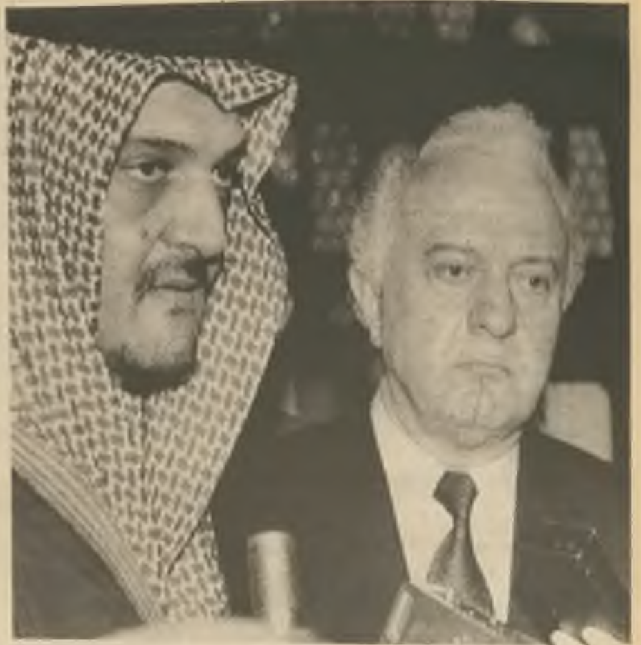
Princ Saud al-Faisal, vlevo, saudský zahraniční ministr a jeho sovětský protějšek Eduard A. Shevardnadze, mluví s reportéry v Moskvě. Princ se setkal s prezidentem Michaiilem S. Gorbačovem aby přerokovali záležitost Kuwajtské krise a obnovení diplomatických vztahů přerušovaných před 52 lety.

Pod tlakem programu "prodávat", který byl podnícen skokem v cenách ropy a pověstí o válce v Perském zálivu, ceny akcií ostře spadly. Koncem uplynulého týdne průmyslové Dow Jones poklesly o 43.07 bodů na 2582.67. Dolar šel opět silně dolů, již druhý den za sebou.