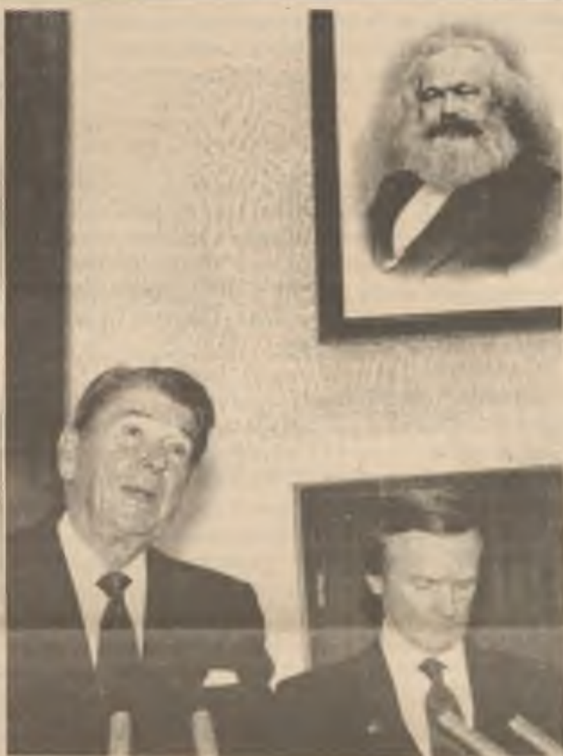
Ronald Reagan promluvil k sovětským autoritám při portrétu Karla Marxe. Muž vpravo byl překladatel.