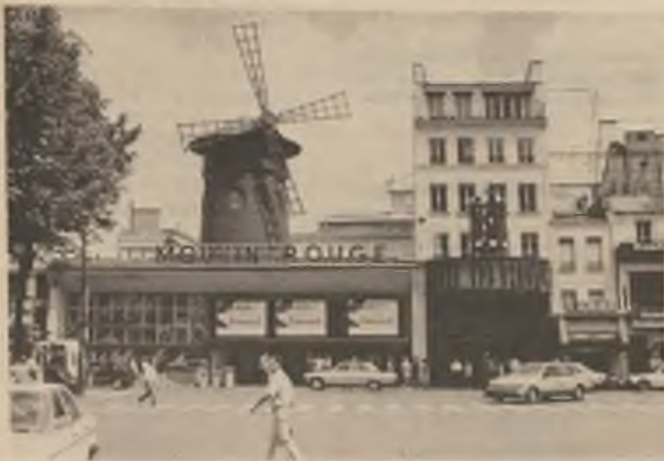
Náměstí Blanche v končinách známých spíše jako Pigalle.