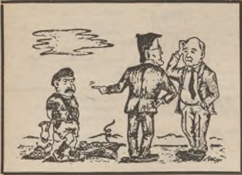
„V roce 1990 se už pytláctví tolerovat nesmí.“ (Kresba M. Kounovský)