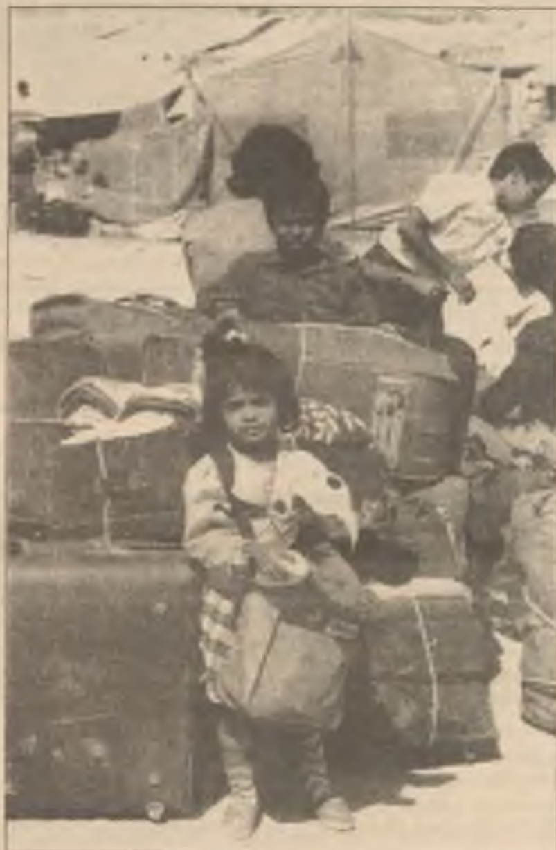
Asijské děti, přemístěné Irackou invází Kuwaitu, čekají na povolení odcestovat domů z tohoto uprchlického tábora v Azraqu, v Jordánu.