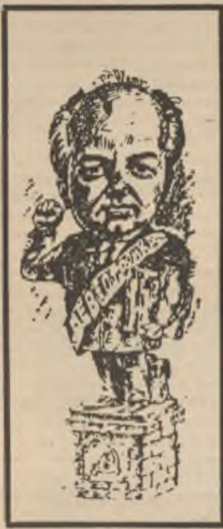
Šampion perestrojky (týdeník Moskovskije novosti)

Každý ví, že kamenem úrazu ve vzájemných vztazích jsou čty- ři nevelké ostrovy, které si SSSR na samém konci druhé světové války přivlastnil jako suvenýr, jako konec kurilského přívěsku, vislého z kamčatské vesty. S po- stupem obecné i vojenské tech- nologie se stává nesmyslnou ar- gumentace o jejich strategickém významu. Možná, že ještě včera se o tom tak dalo mluvit. Zítřejí už vůbec ne. Jde jen o jejítnou prestižní záležitost superkonti- nentálního giganta, který ze zls- kaných ostrovů (jež by se doce- la dobře ztratily třeba v Bajkal- ském jezeře) deportoval několik tisíc japonských rybářských ro- din. Stačí nalstovat Stalínovo prohlášení (mělo formu úvodní- ku v „Pravdě“ v září 1945), aby hloubka této jejítnosti byla zjev- ná. Porážkou Japonska, jak bylo z textu zřejmé, se vyrovnávaly