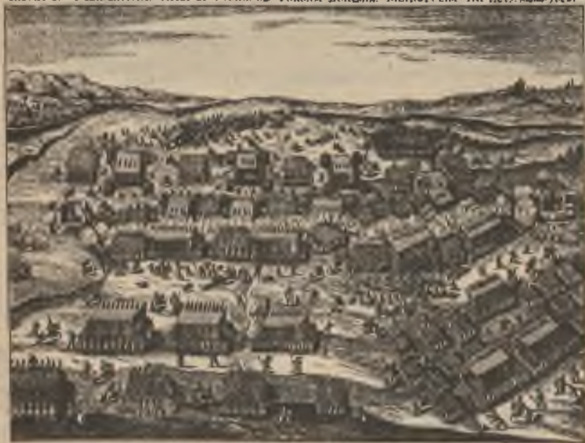
BITVA BĚLOHOR- SKÁ 8. LISTOPADU 1620.