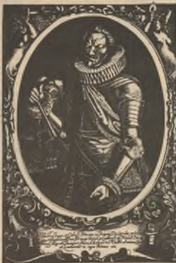
KAREL KNÍŽE LICHTENŠTEJN. Kat šlechty české