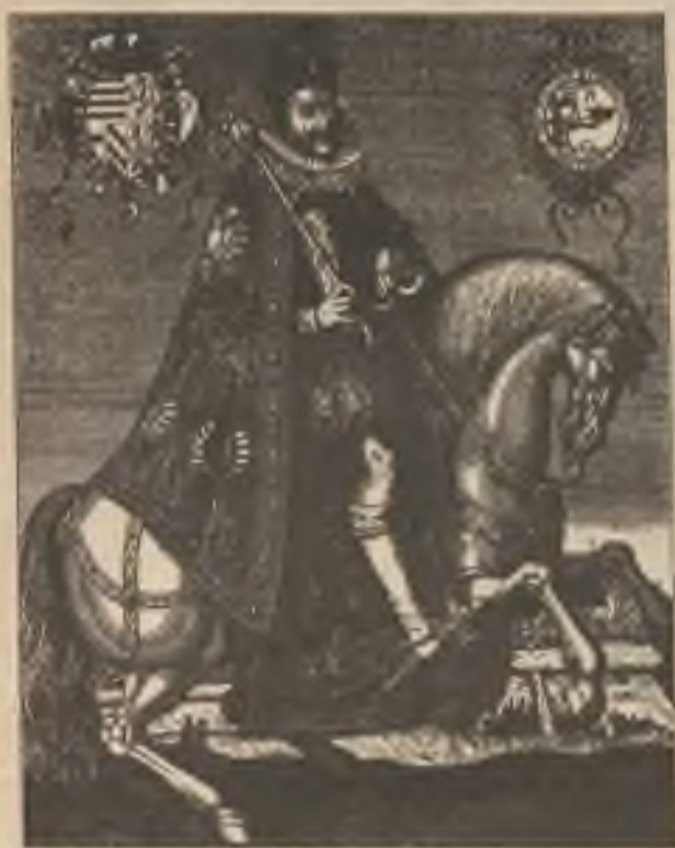
FERDINANDUS II. DG. ROM. IMP. SEMP. AUG. GERM. HUNG. BOH. DAL. CR. SCL. REX. ARCHID. AUST. DUX BURG. ST. CAR. CARN. WIRS. ET INF. SILES. MARCH. MOR. ET SUP. ET INF. LUS. CO. HAB. TYROL. GORTZ.