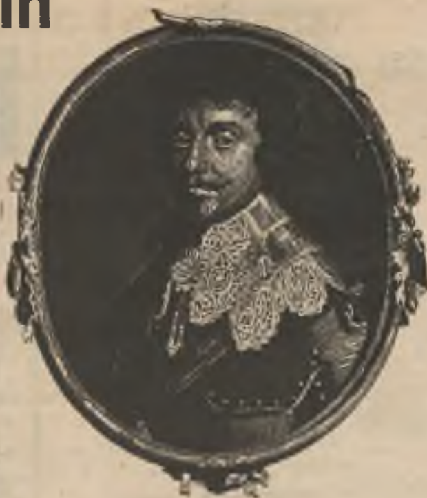
BEDŘICH FALCKÝ, ZIMNÍ KRÁL.