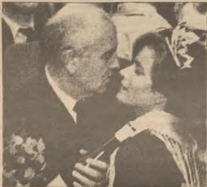
Neříkejte to Raise: Německá "Miss Wine" se chystá dát "mokrou" na rty Michaila Gorbachova po tom co ho obdarovala lahví vína při jeho návštěvě v Deidesheimu v Německu.