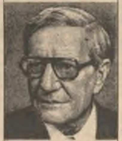
КИМ ФИЛБИ 1912—1988

Harold "Kim" Philby, agent KGB, před tím než utekl z Anglie, je vyobrazen na sovětské poštovní známce.