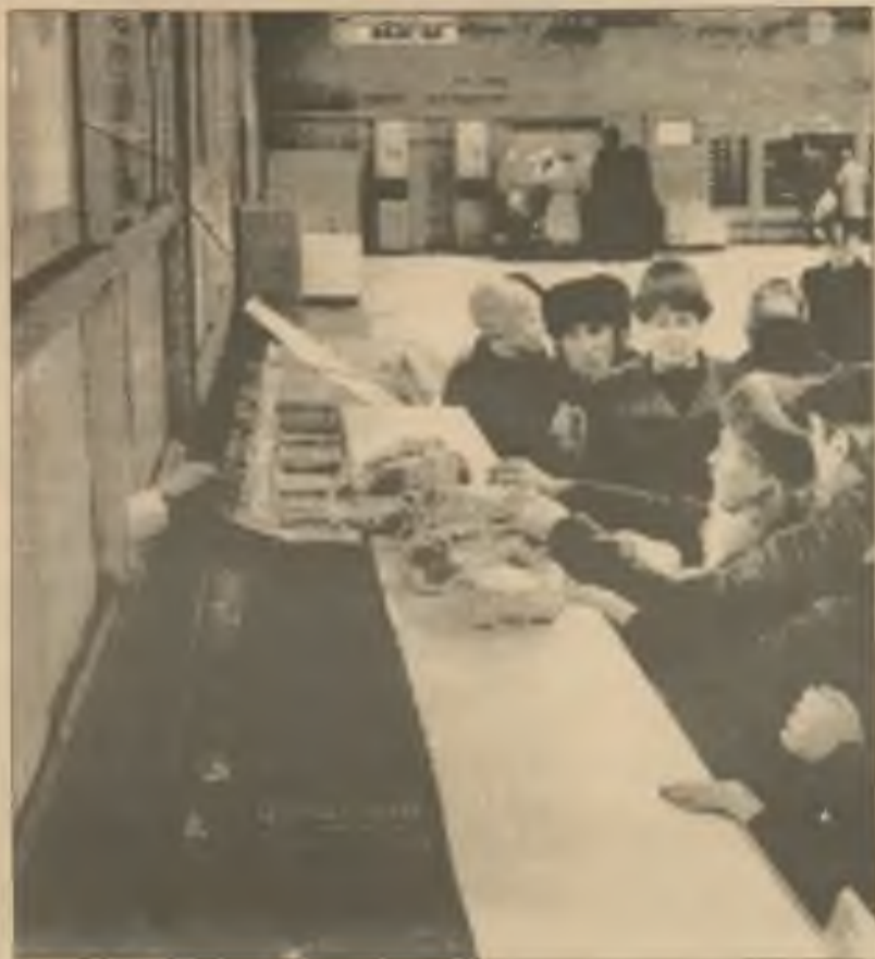
Residentky Moskvy se derou o pár kousků masa na holém pultu řeznického krámu.