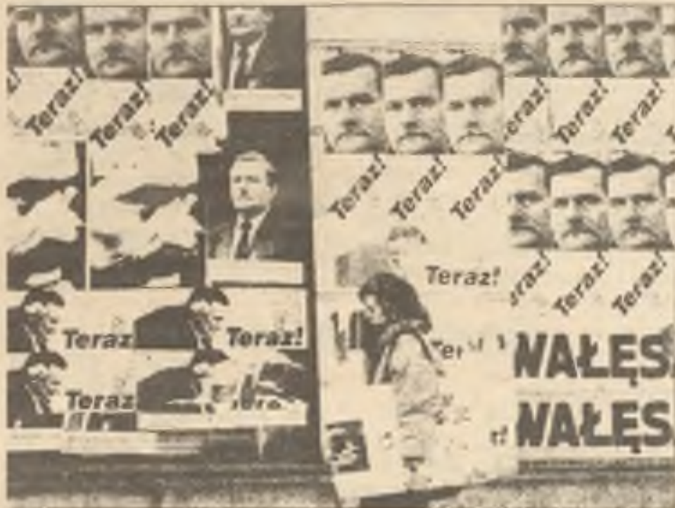
Čas rozhodnutí v Polsku Plakáty za volební kampaně pro Lecha Walesu na presidentský úřad byly nalepeny na zdi ulice před nedělními volbami v kterých tento kandidát vyhrál.