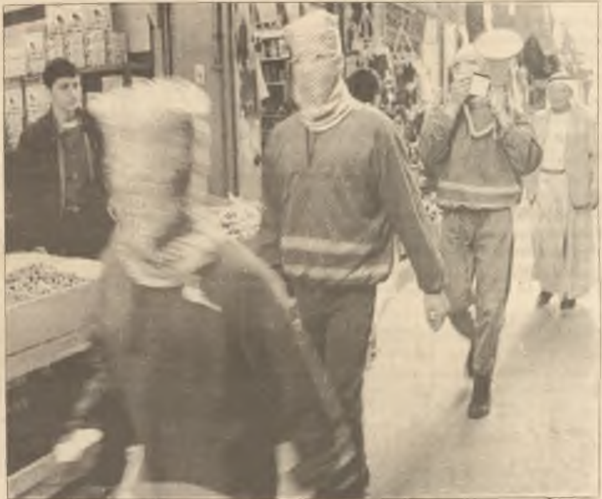
Maskovaní Pařestinci pochodovali po trhu minulý týden v Nabluse na West Bank (Západním břehu) okupovaném Izraelem. V posledních dvou měsících byly vztahy mezi Izraelci a Palestinci stále více napjaté.

"Fed" odstranil pravidlo, které vyžaduje, aby bankovní ústavy držely jakožto rezervu 3% některých korporečních osvědčených cenných papírů, jakožto zástavu. Tato akce má pomoci bankám a hospodářství.